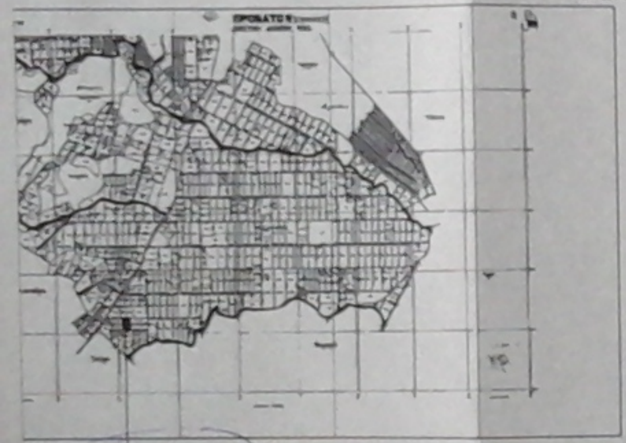
ΤΕΜΑΧΙΟ ΜΕ ΑΡ. 586