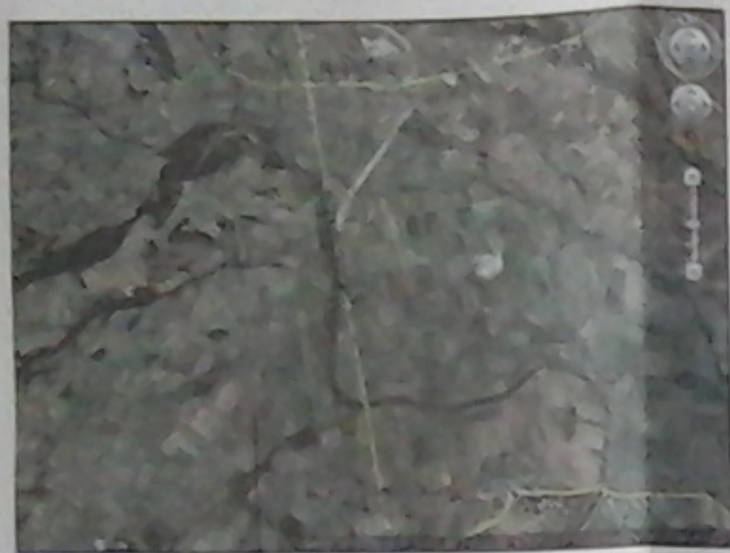
ΤΕΜΑΧΙΟ ΜΕ ΑΡ. 897