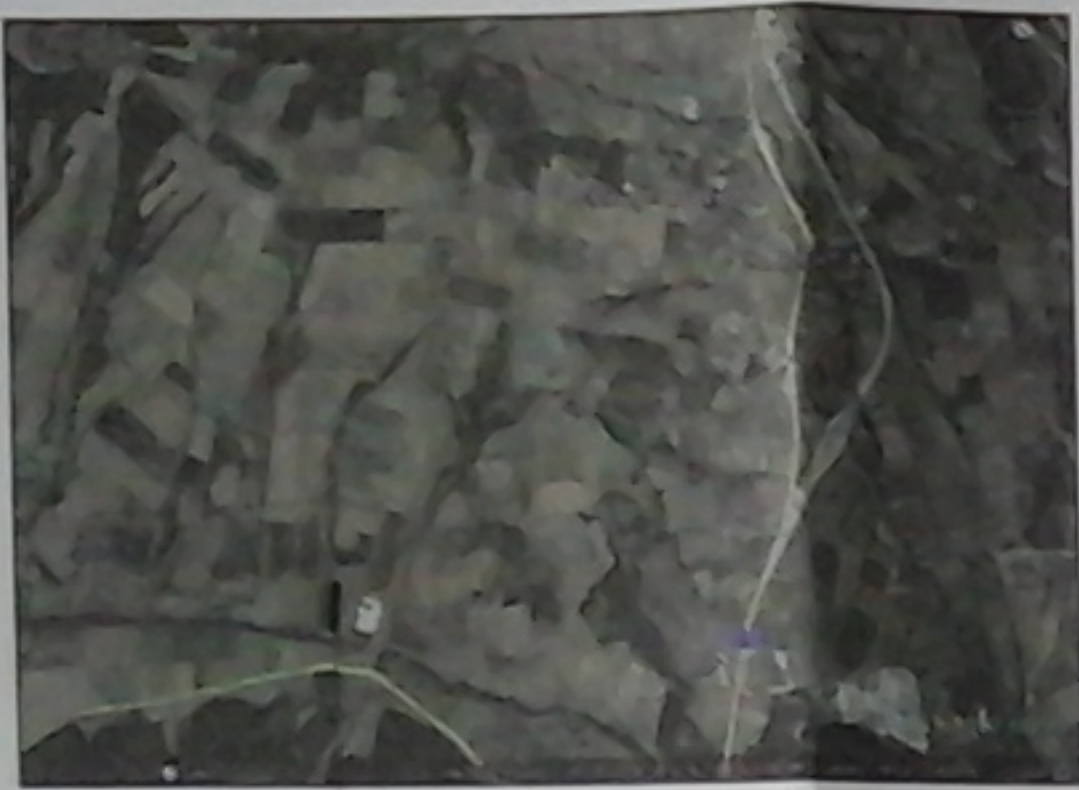
ΤΕΜΑΧΙΟ ΚΑ ΑΡ. 355