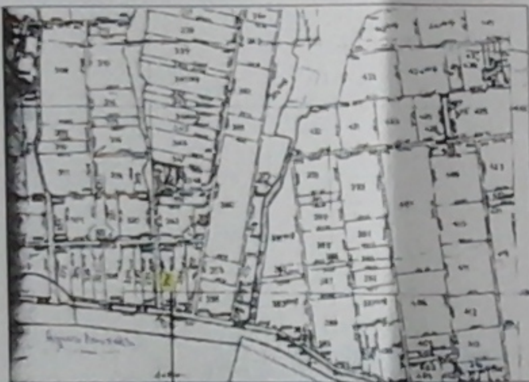
ΤΕΜΑΧΙΟ ΚΑ ΑΡ. 355