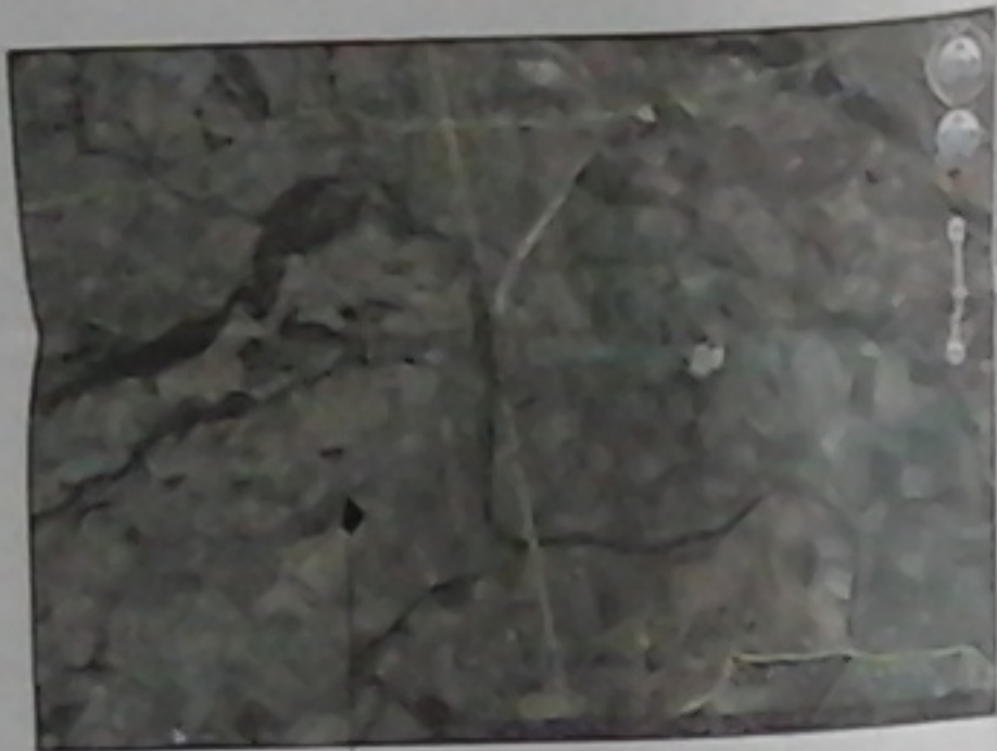
ΤΕΜΑΧΙΟ ΜΕ ΑΡ.611