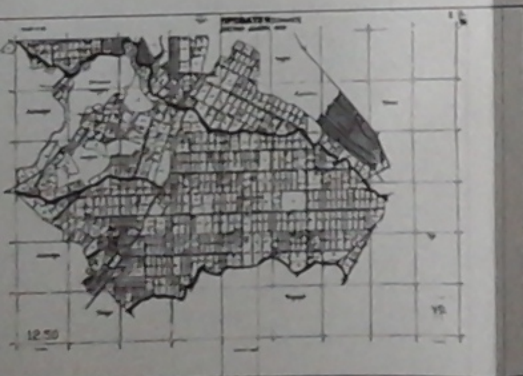
ΤΕΜΑΧΙΟ ΜΕ ΑΡ.611