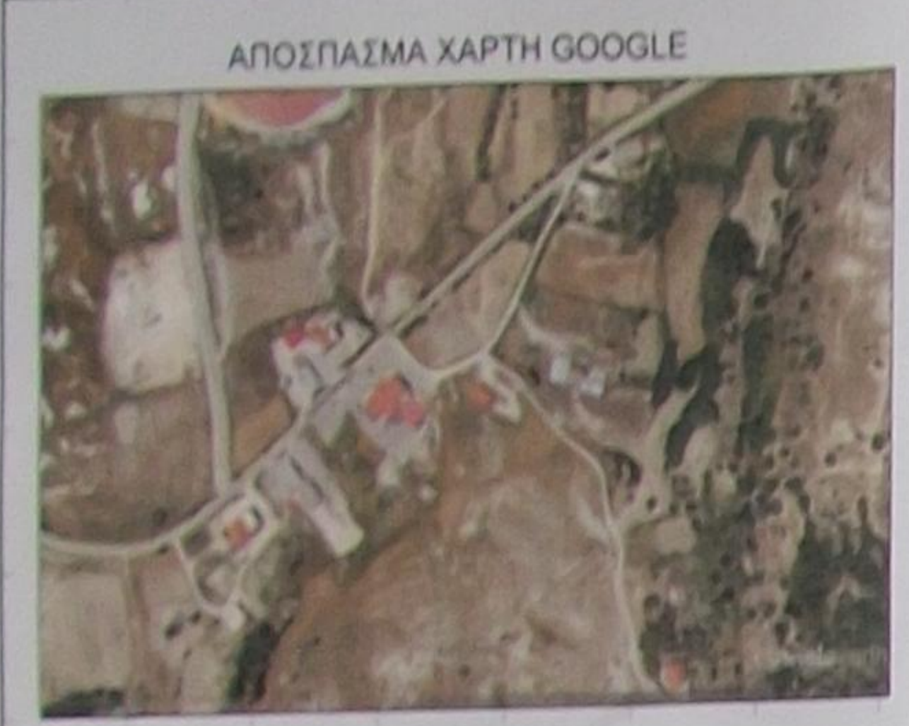
ΑΠΟΣΠΑΣΜΑ ΧΑΡΤΗΣ GOOGLE