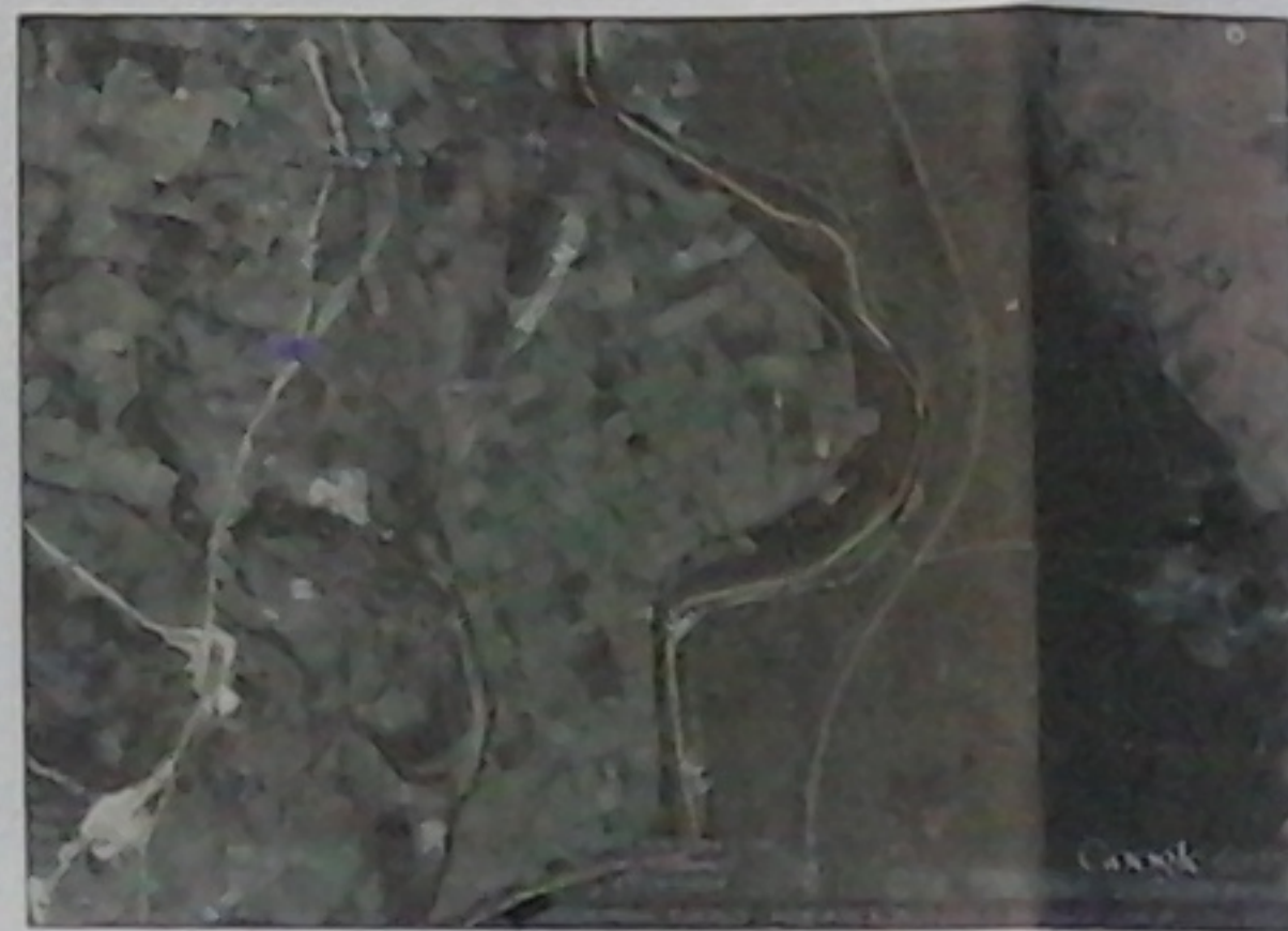
ΑΓΡΟΤΕΜΑΧΙΟ ΙΔΙΟΚΤΗΣΙΑΣ ΑΓΓΕΛΑΚΗΣ ΓΕΩΡΓΙΟΥ