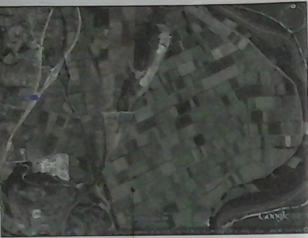
ΤΜΧ ΜΕ ΑΡ.318