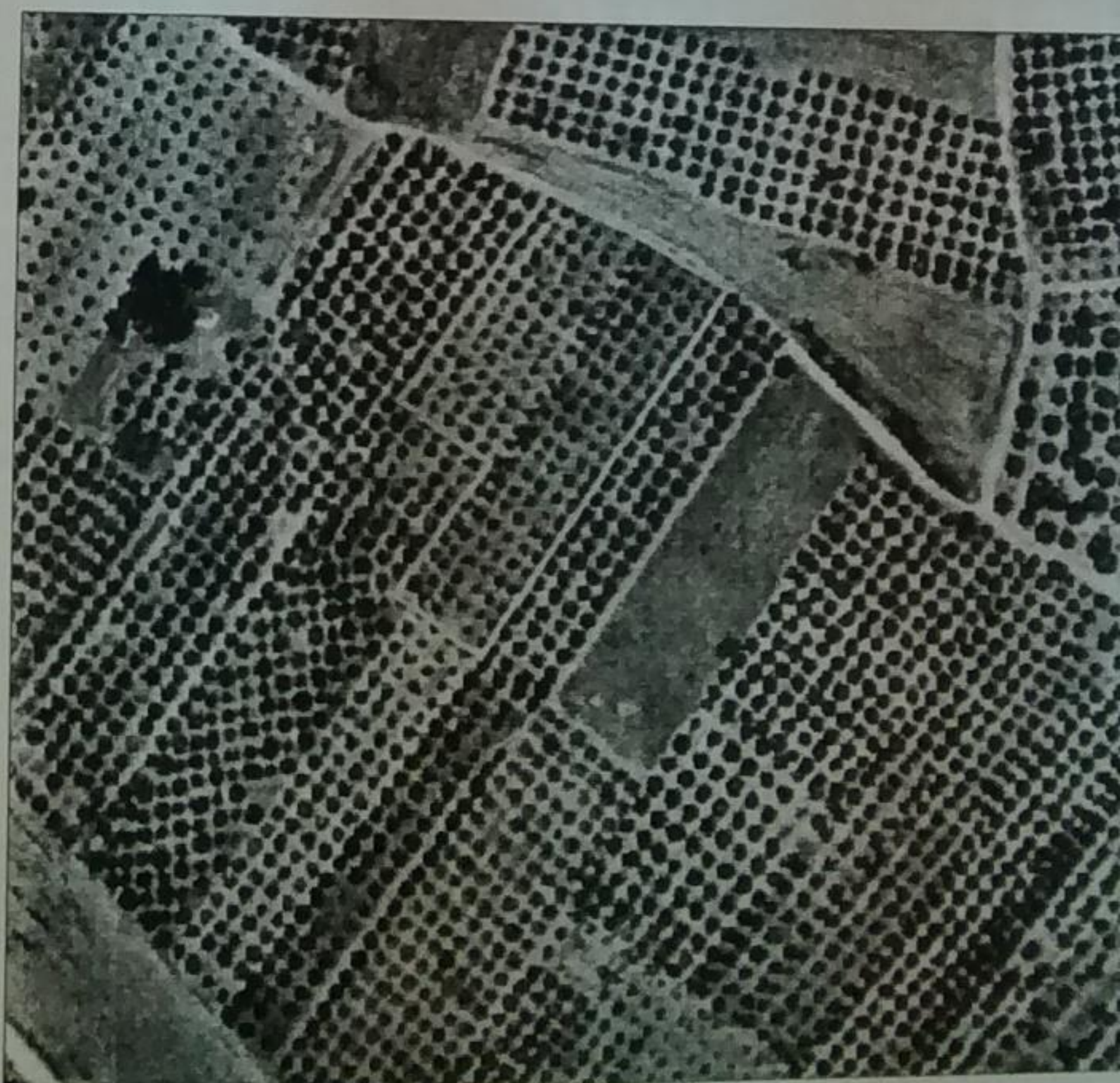
ΑΠΟΣΠΑΣΜΑ ΑΠΟ ΟΡΘΟΦΩΤΟΧΑΡΤΗ