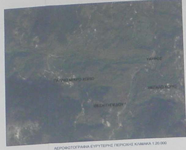
ΑΕΡΟΦΩΤΟΓΡΑΦΙΑ ΕΡΓΟΥ ΓΕΩΡΓΙΑ ΚΑΜΑΚΑ 1:20.000