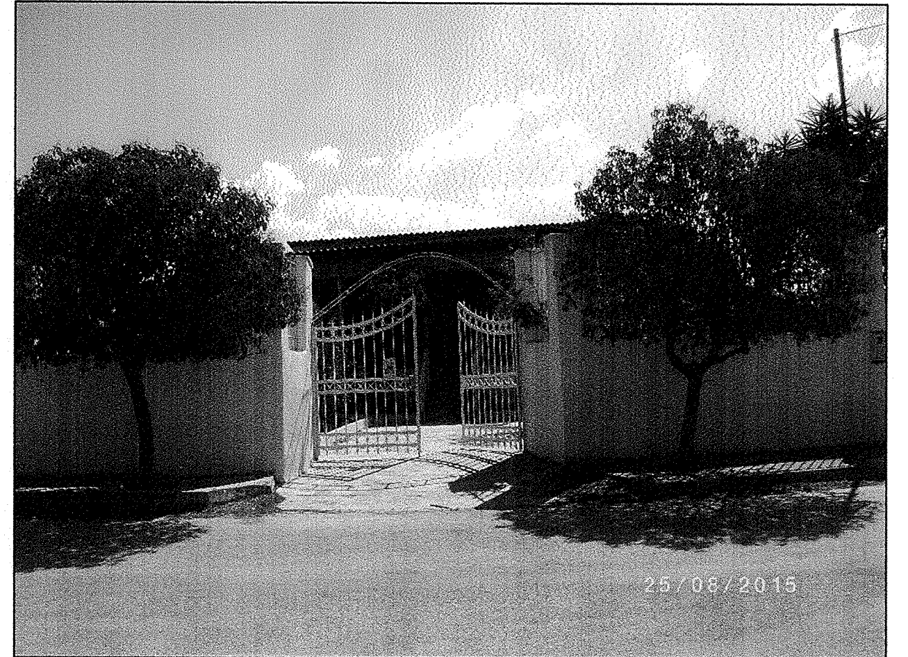
ΛΗΨΗ ΦΩΤΟΓΡΑΦΙΑΣ (Φ1)