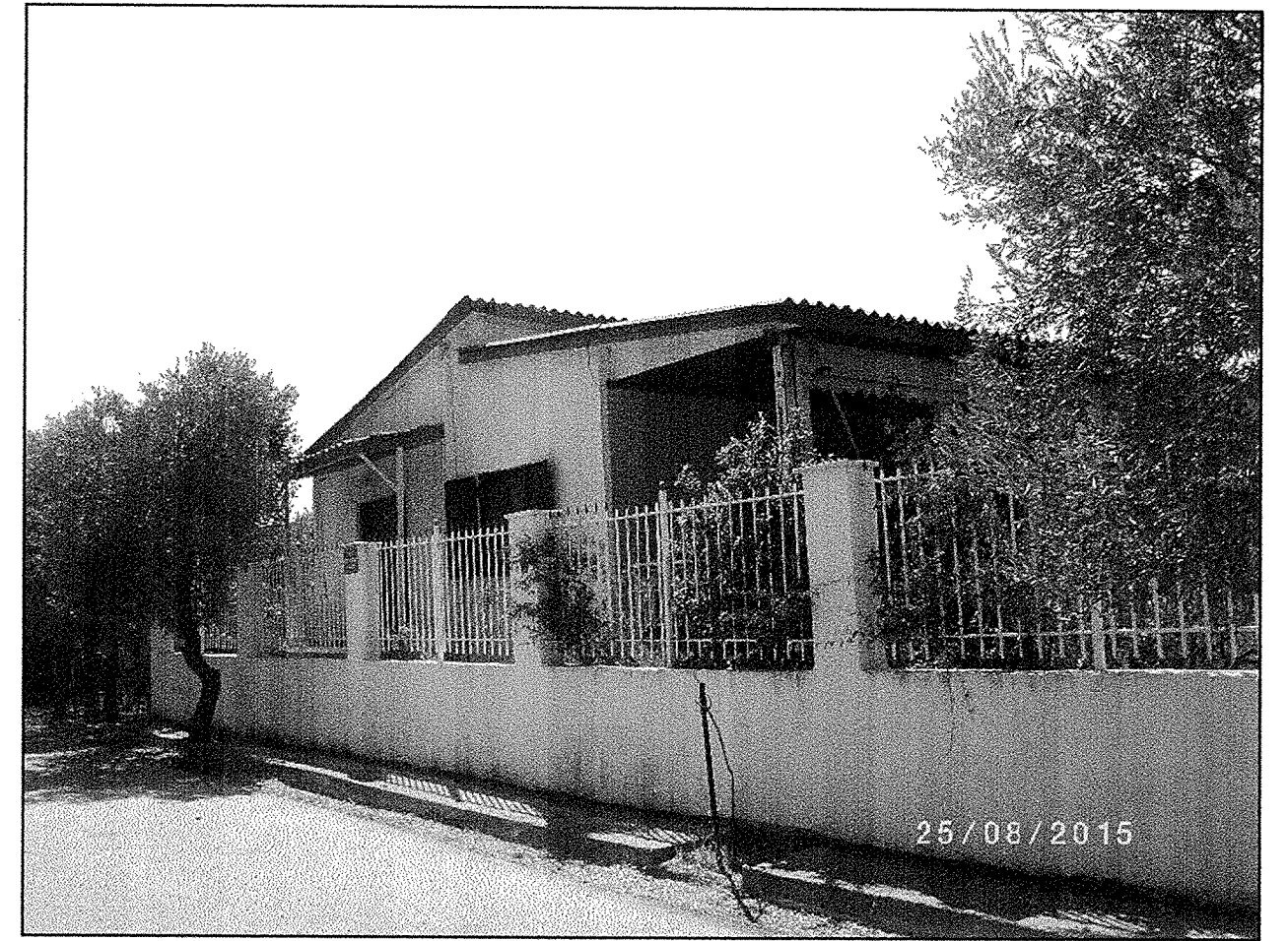
ΛΗΨΗ ΦΩΤΟΓΡΑΦΙΑΣ (Φ2)