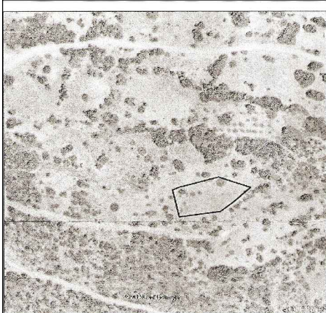
ΑΕΡΟΣΦΑΙΡΑ ΟΡΘΟΦΩΤΟΧΑΡΤΗ ΚΤΗΜΑΤΟΛΟΓΙΟΥ ΜΕ ΘΕΣΗ ΓΕΩΤΕΜΑΧΙΟΥ.