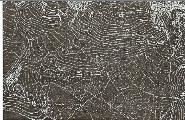
ΛΠΟΣΤΑΣΜΑ ΧΑΡΤΗ ΚΑΙ 1:5000 Γ.Υ.Σ. ΥΠΙ ΑΡΙΘΜ. 6216-2 ΜΕ ΘΕΣΗ ΓΕΩΤΕΜΑΧΙΟΥ.