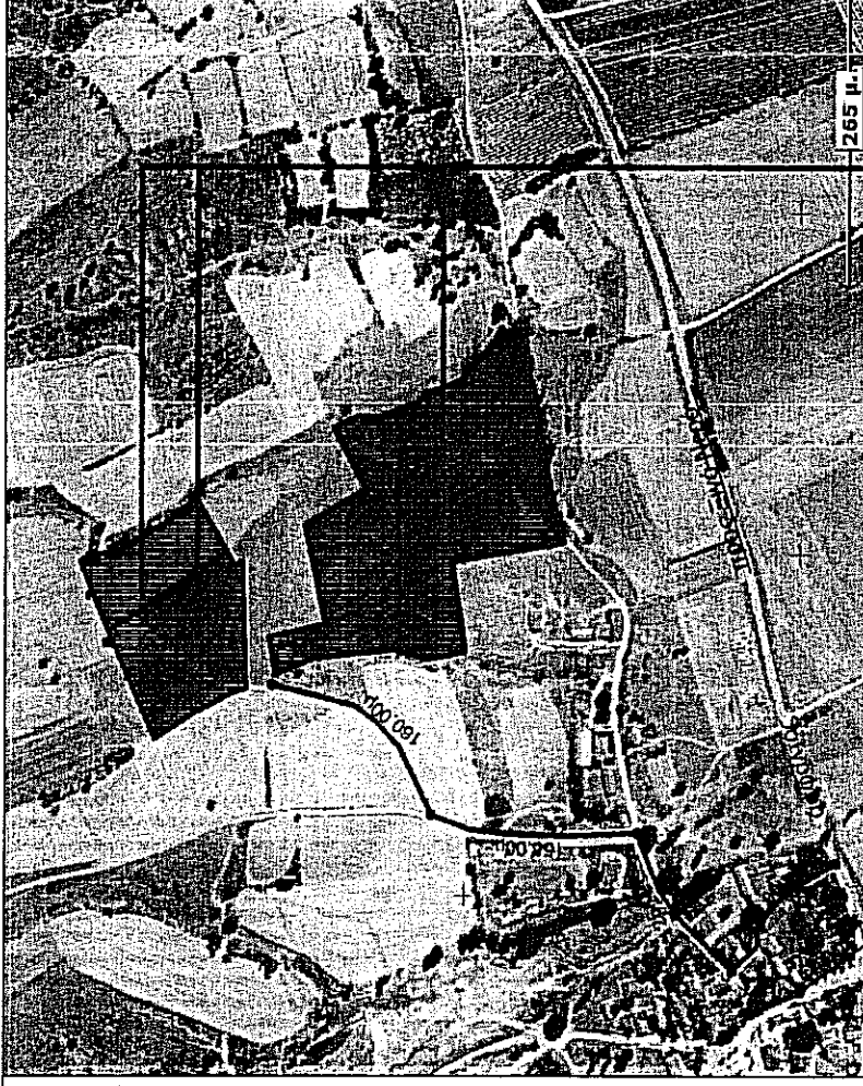
αεροπορικό ακοδομήτρια θέση αγροτεμαχίων