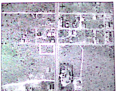
ΑΠΟΣΠΑΣΜΑ ΟΡΘΟΦΩΤΟΧΑΡΤΗ κλ. 1/5000

ΔΗΛΩΣΗ ΜΗΧΑΝΙΚΟΥ ΤΟΥ Ν 651/77 Ο κατωθι υπογεγραμμένος ΚΑΤΗΡΤΖΙΔΗΣ ΙΩΑΝΝΗΣ (πολ. μηχαν - τοπ. μηχαν) δηλώνω υπεύθυνα ότι το αγροτεμάχιο εμβαδού E= 4.000 M2 τμήμα του τεμαχίου 1984 στο αγρόκτημα κ.ΝΕΥΡΟΚΟΠΙΟΥ της Περιφερειακής Ενότητας Δράμας, όπως αυτό περιγράφεται στο παρόν τοπογραφικό, είναι άρτιο και οικοδομήσιμο σύμφωνα με τις ισχύουσες Πολυτομιακές Διατάξεις. Είναι εκτός σχεδίου και εντός ζώνης των 500μ. από το όριο οικισμού και δεν φοιτείται εκπορεύσει σε τί ή χρήση σύμφωνα με τις διατάξεις του Ν 1337/1983. Δηλώνω επίσης ότι το ως άνω αγροτεμάχιο έχει πρόσβαση σε Εθνική οδό και δεν έχει ενταχτεί σε ΓΠΣ (Γενικό Πολεοδομικό Σχέδιο) ούτε σε ΖΟΕ (Ζώνη Οικιστικού Εμφυλίου), ούτε επίσης σε περιοχή που τελεί υπό κτηματογράφηση βάσει του Ν 2308/15-6-95 περί Εθνικού Κτηματολογίου. Απέχει από τη θάλασσα περισσότερο από 800 μέτρα και δεν διέρχεται μέσα από το τεμάχιο ρέμα. Δεν διέρχεται γραμμή υψηλής τάσης της ΔΕΗ από πάνω ή πλησίον του, ενώ δεν διέρχονται ούτε υπόγειες ή υπέργειες κοινωφελείς εγκαταστάσεις.