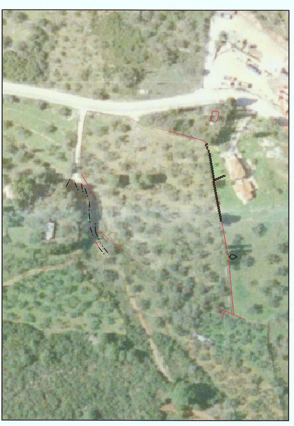
ΑΠΟΣΠΑΣΜΑ ΟΡΘΟΦΩΤΟΓΡΑΦΙΑΣ ΚΤΗΜΑΤΟΛΟΓΙΟΥ

Ο ΔΗΛΩΣΤΗΣ ΤΟΥ ΑΠΡΟΚΤΗΜΑΤΟΣ ΠΙΣΤΕΥΩ ΟΤΙ ΤΑ ΟΡΘΑ ΠΟΤ ΕΧΕΙ ΙΣΠΟΙΩΣΕΙ ΕΙΝΑΙ ΟΡΘΑ. Ο ΔΗΛΩΣΤΗΣ ΤΟΥ ΑΠΡΟΚΤΗΜΑΤΟΣ ΔΗΛΩΣΗ ΤΥΠΟΠΟΙΗΣΗΣ ΟΡΙΩΝ ΔΕΛΤΑ ΕΡΓΟΥ ΔΗΛΩΣΗ ΤΥΠΟΠΟΙΗΣΗΣ ΟΡΙΩΝ ΔΕΛΤΑ ΕΡΓΟΥ ΔΗΛΩΣΗ ΤΥΠΟΠΟΙΗΣΗΣ ΟΡΙΩΝ ΔΕΛΤΑ ΕΡΓΟΥ