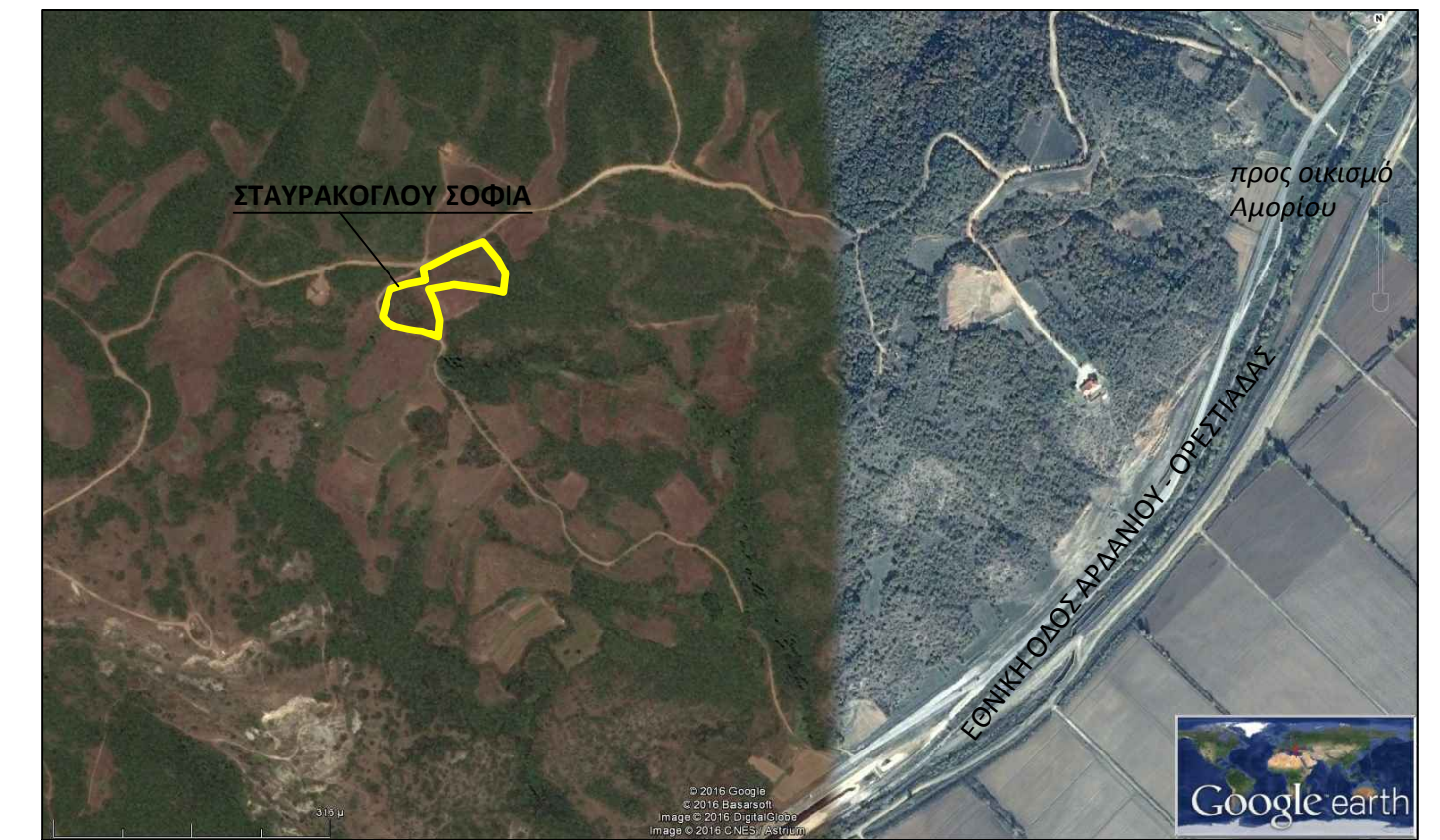
ΘΑΛΙΠΟΡΙΚΟ ΣΚΑΡΙΦΗΜΑ ΑΠΟ GOOGLE EARTH, Κλίμακα 1:8500