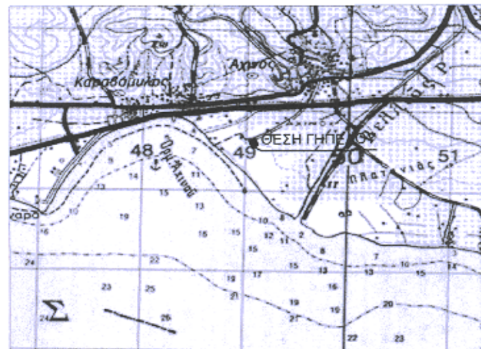
ΑΠΟΣΠΑΣΜΑ ΧΑΡΤΗ Γ.Υ.Σ. 1:5.000 (5365-1)