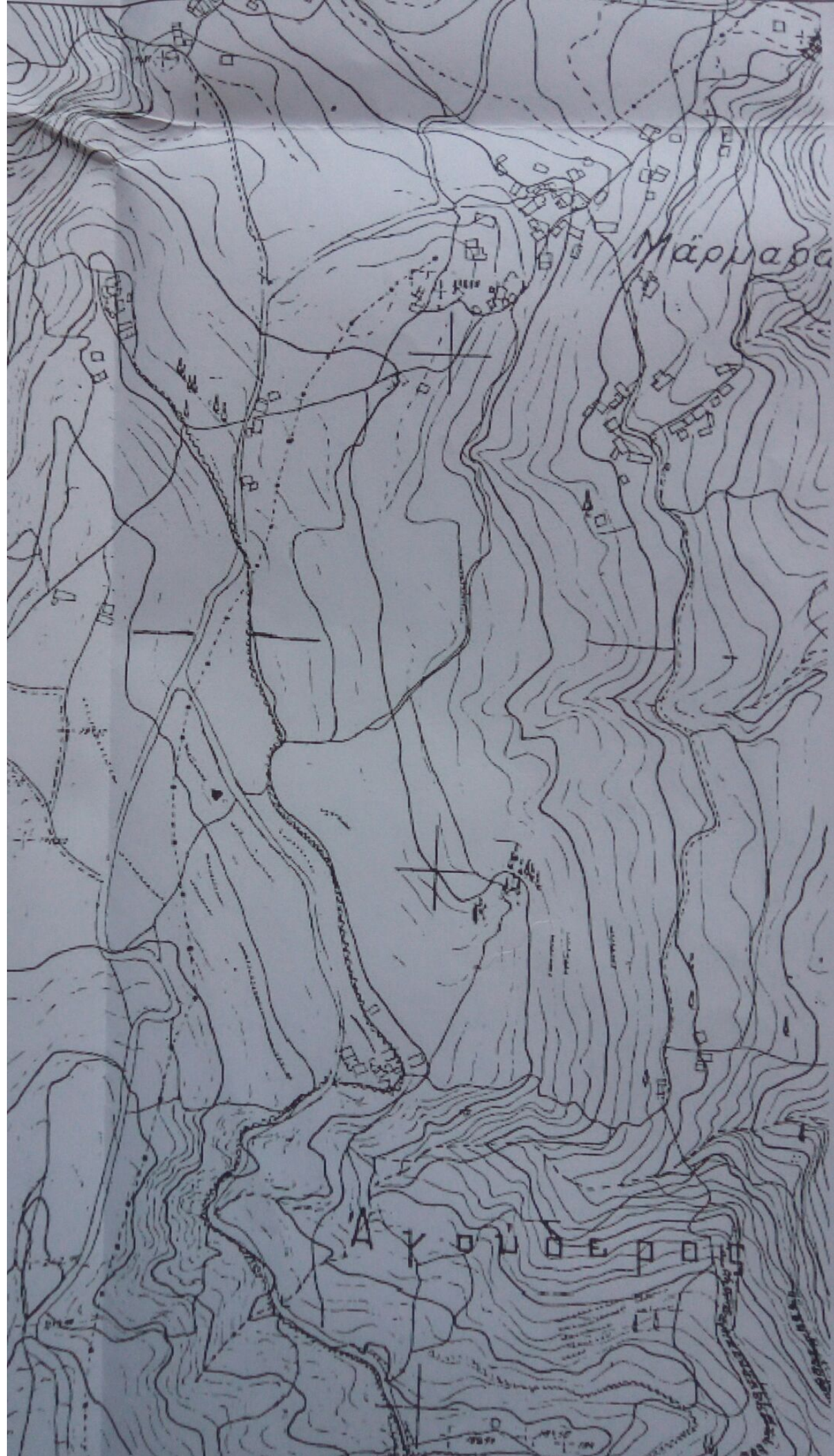
Δημήτρη Απόσπασμα χάρτη Κλίμακα 1:5000 Φ.Χ. 6331 5