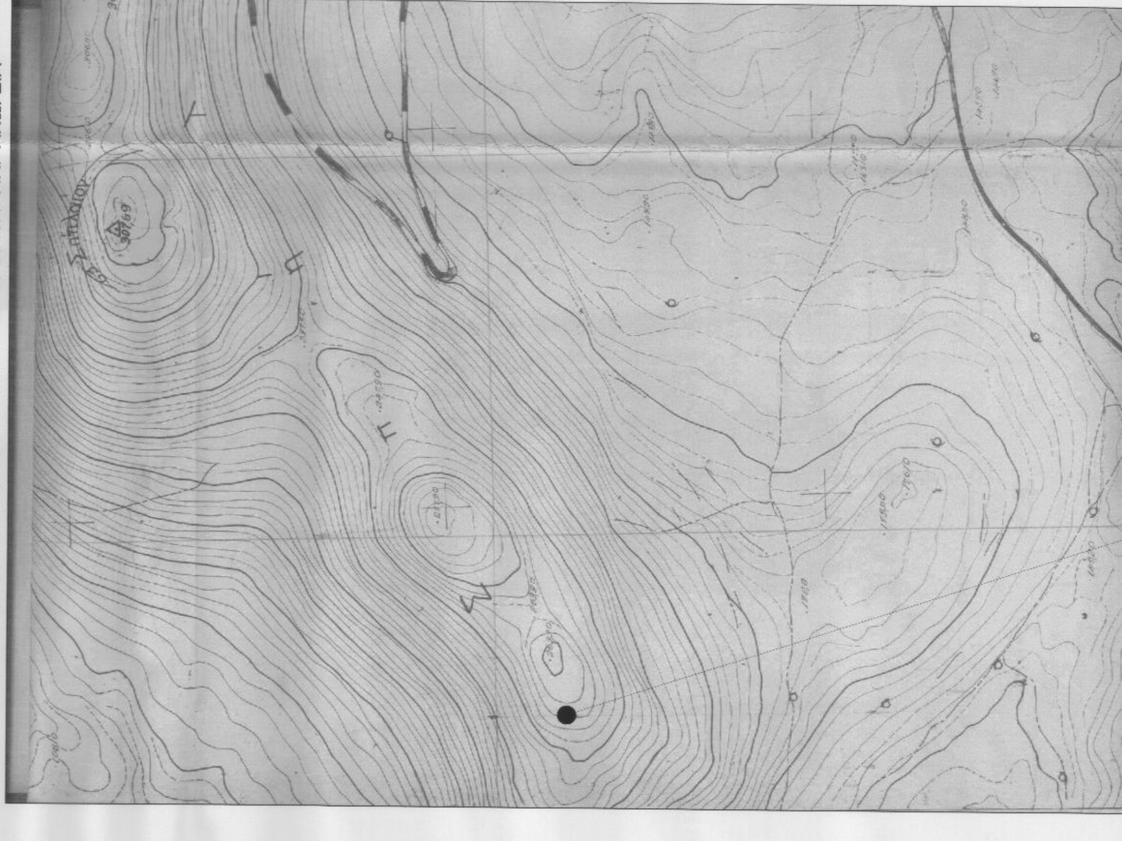
ΑΠΟΣΤΑΣΜΑ ΔΙΑΓΡΑΜΜΑΤΟΣ 1:5.000 Γ.Υ.Σ. Νο 9515/1 Φ.Χ. "ΑΝΩΓΕΙΑ"