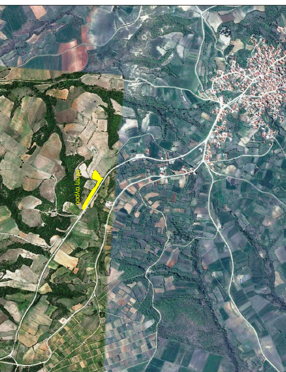
Οδοτοπικό ακριβήγραμμα αποσπάσμα από το google earth