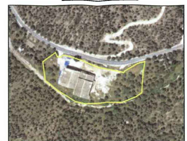
ΘΕΣΗ: "ΠΙΤΡΑΣ ΓΕΦΥΡΙ" ΑΓΡ. ΠΕΡΙΦ. ΤΡΥΓΟΝΑ - ΔΗΜΟΥ ΛΕΣΒΟΥ ΙΔΙΟΚΤΗΣΙΑΣ: ΕΑΣ ΛΕΣΒΟΥ