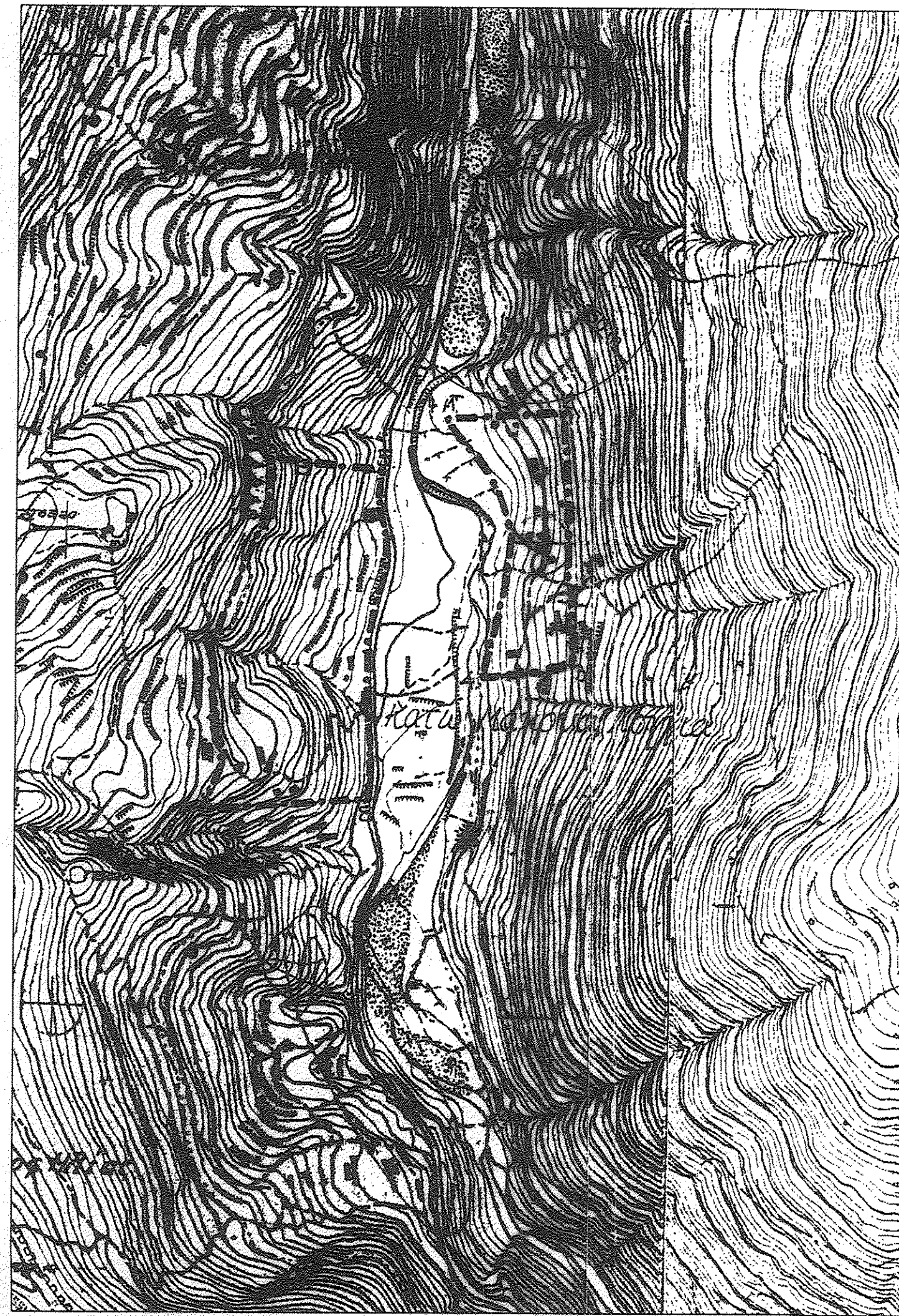
ΑΠΟΣΠΑΣΜΑ ΧΑΡΤΗ (ΚΛ. 1:5.000)