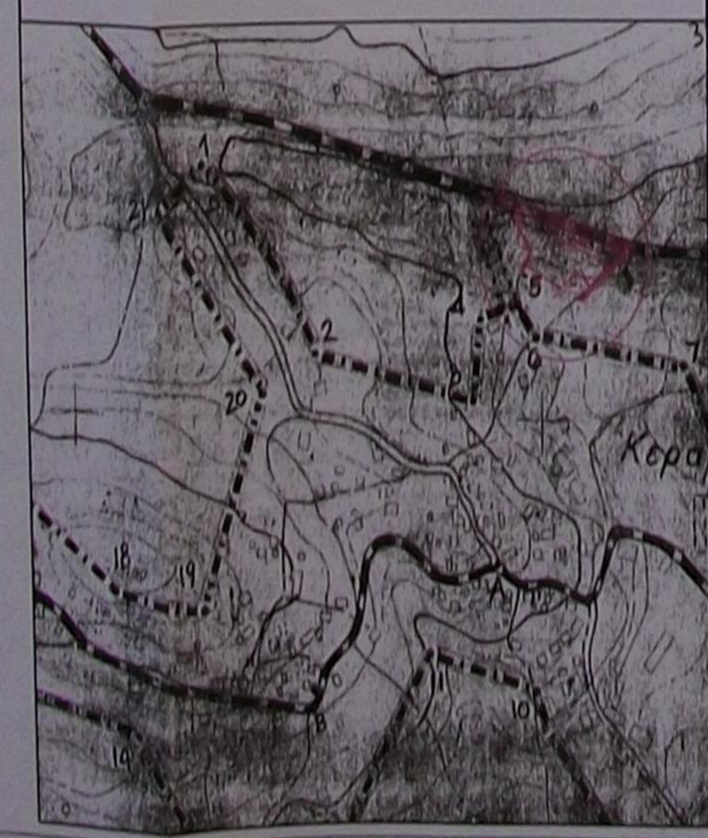
ΟΔΟΠΟΡΙΚΟ ΣΧΑΡΙΦΗΜΑ ΚΛΙΜΑΚΑ 1/5000

ΘΕΩΡΗΘΗΚΕ Σύμφωνα με την αρ. 11315/48-16 πράξη χαρακτηρισμού της Δ/νσης Ασπ. Κεφαλονιάς, του οποίου αποτελεί αναπόσπαστο μέρος, 4.8.2016