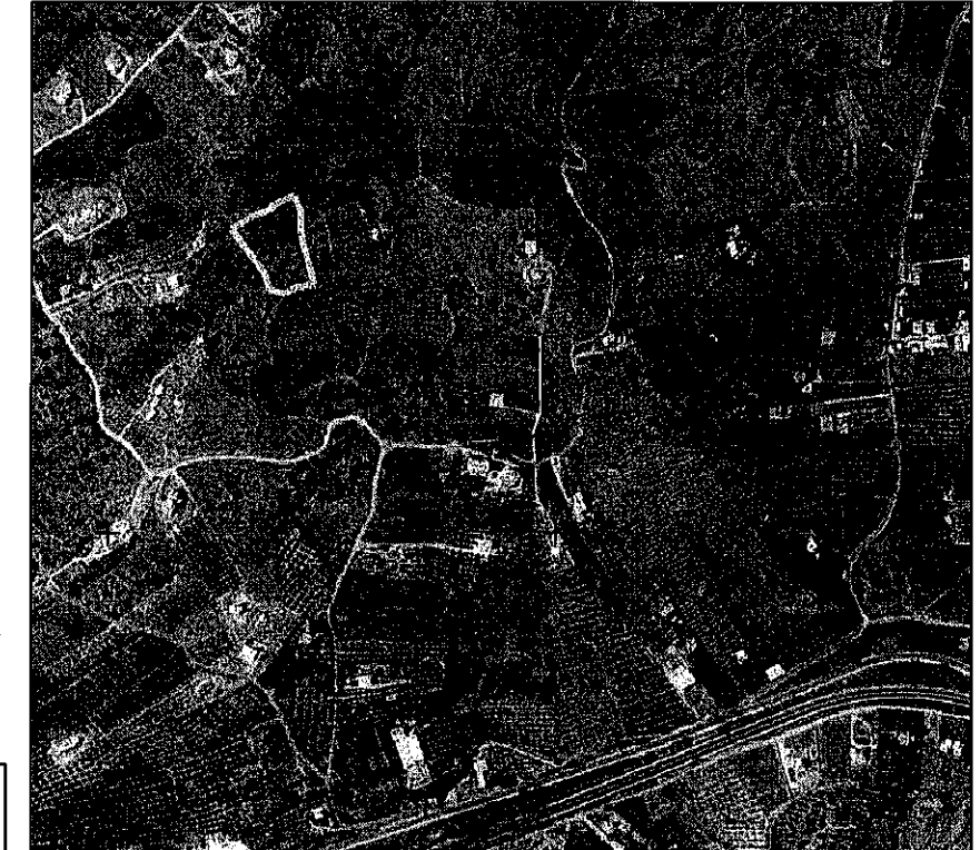
ΑΠΟΣΠΑΣΜΑ ΟΡΘΟΦΩΤΟΧΑΡΤΗ ΕΚΧΑ ΑΕ (ΚΛ. 1:5.000)