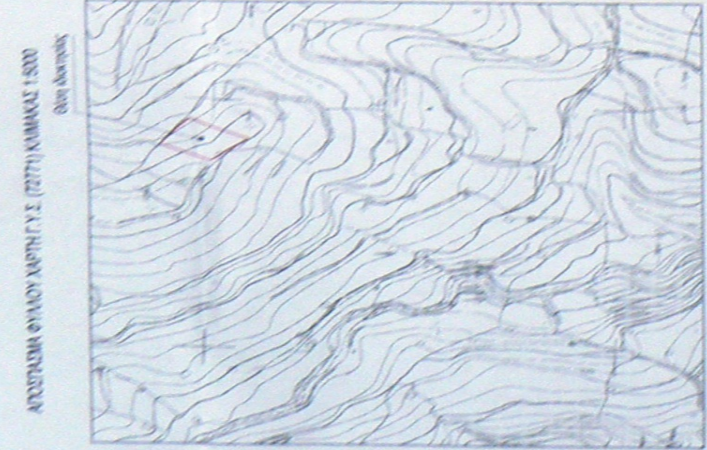
ΑΓΩΓΑΣΙΑ ΦΥΛΟΥ ΑΡΧΑΙΑ Τ.Κ.Σ. (72777) ΚΙΛΙΚΑΚΑΣ 1:500 Ελευθέριος Ελευθέριος