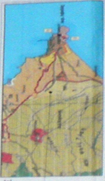
ΑΓΩΓΑΣΙΑ ΣΧΟΛ. ΚΟΡΙΝΘΗΣ ΚΙΛΙΚΑΚΑ 1:5000