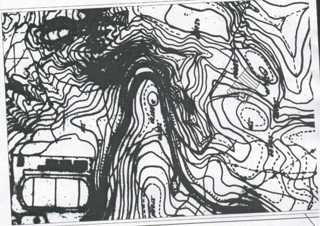
ΑΝΤΙΣΤΑΣΗ ΑΠΟ ΟΡΟΓΡΑΦΟΛΟΓΗ ΤΟΥ ΚΤΗΜΑΤΟΛΟΓΙΟΥ

ΜΕΝΟΣ ΤΕΕ - ΑΠ. ΜΗΤΡΟΥ 82079 ΚΥΡΑ - ΒΑΣΙΛΙΚΗΣ 21 ΗΓΟΥΜΕΝΙΤΣΑ ΤΗΛ: 26650 21144 - FAX: 26650 29118 ΑΦΜ: 050678173 - ΔΟΥ: ΗΓΟΥΜΕΝΙΤΣΑΣ