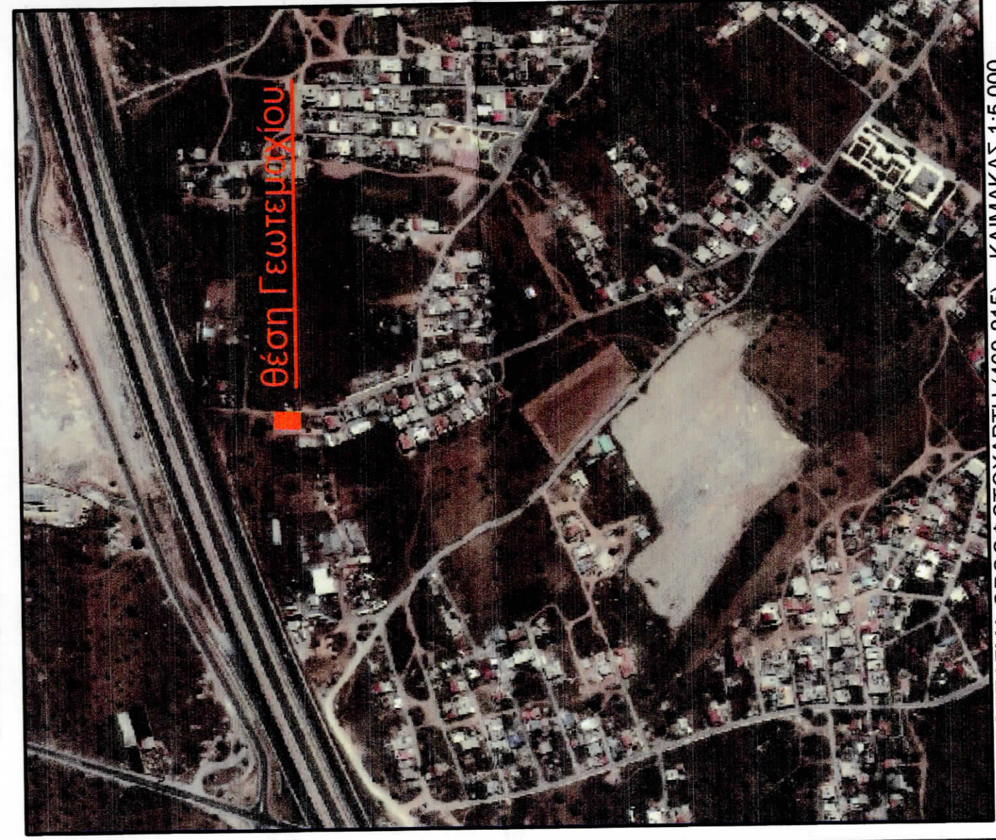
ΑΠΟΣΠΑΣΜΑ ΟΡΘΟΦΩΤΟΧΑΡΤΗ (460-215) - ΚΛΙΜΑΚΑΣ 1:5.000

Πίνακας Συντεταγμένων των κορυφών του γηπέδου στο Γεωδαιτικό Σύστημα Αναφοράς ΕΓΣΑ87