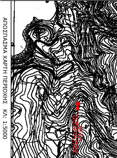
ΑΠΟΣΤΑΣΜΑ ΧΑΡΤΗ ΠΕΡΙΟΧΗΣ ΚΑ: 1:5000

ΘΕΩΡΗΣΗ Το παρόν τοπογραφικό δελτάγραμμο θεωρείται και επισημαίνεται στο υπ' αριθμ. 2311/0310-2016 έγγραφο μας του οποίου αποτελεί όλο εής αναπόσπαστο μέρος Χητιά 05-10-2016 Χητιά 05-10-2016 Η Εισηγήτρια Η Δημήτριά Δασίου Χητιά ΕΛΛΑΣ Π. Νούτσικ ΠΟΛ. ΣΚΗΦΑΚΙΩΝ