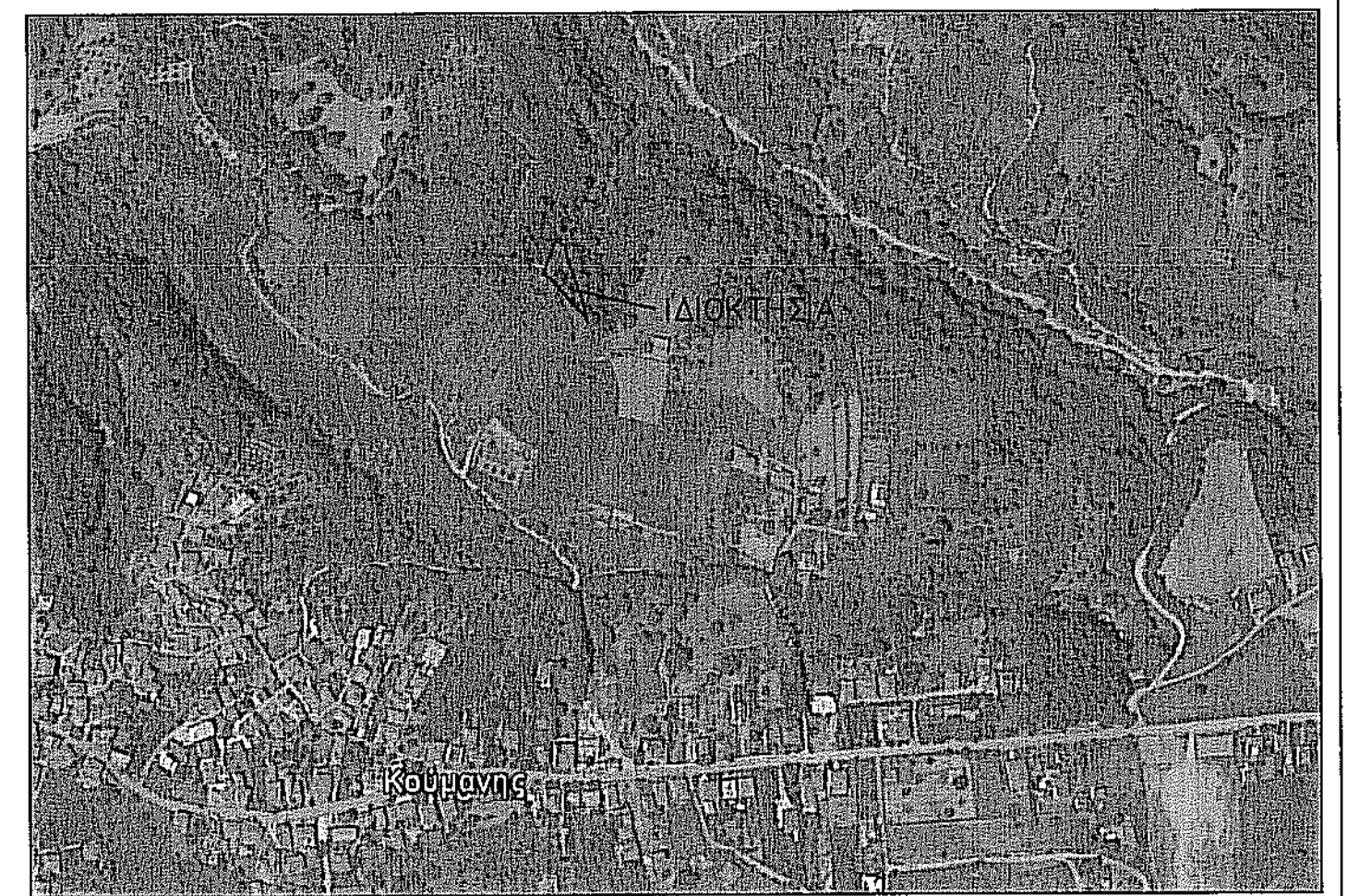
ΟΔΟΠΟΡΙΚΟ ΣΚΑΡΙΦΗΜΑ - ΑΕΡΟΦΩΤΟΓΡΑΦΙΑ ΠΕΡΙΟΧΗΣ