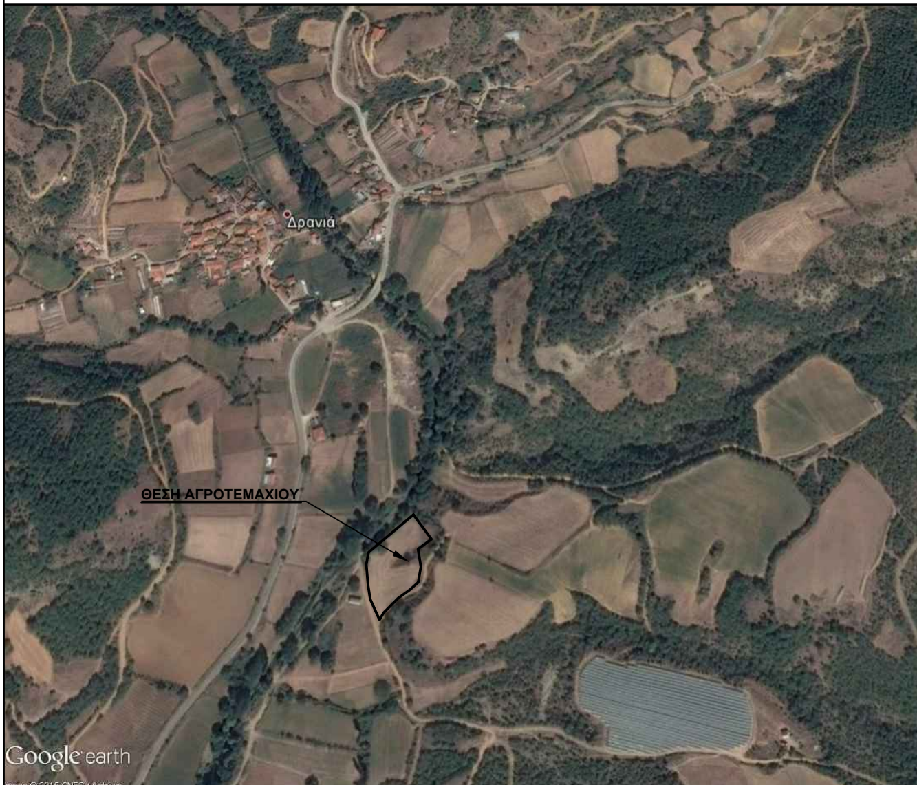
ΑΠΟΣΠΑΣΜΑ ΔΙΑΓΡΑΜΜΑΤΟΣ ΘΕΣΗ ΑΓΡΟΤΕΜΑΧΙΟΥ