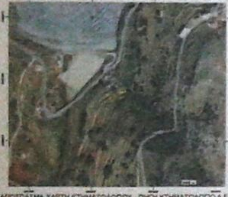
ΑΠΟΣΠΑΣΜΑ ΧΑΡΤΗ ΚΤΗΜΑΤΟΛΟΓΙΟΥ - ΠΛΗΡΗ ΚΤΗΜΑΤΟΛΟΓΙΟ Δ.Ε.

ΙΔΙΟΚΤΗΣΙΑ ΑΓΝΩΣΤΟΥ ΚΤΙΣΜΑ ΧΕΡΣΙΑ ΕΚΤΑΞΗ (66 ΒΔΜ.ΣΕΣ) Α11 ΙΔΙΟΚΤΗΣΙΑ ΟΡΦΑΝΟΥ ΒΑΣΙΛΗ Εγχειτ (A01...A20,A01) = 253.89 τ.μ. Α12 4166710 Α13