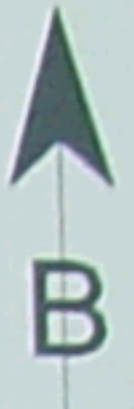
ΓΕΦΥΡΑ ΒΟΥΡΑΙΚΟΥ-ΕΚΤΑΣΗ ΓΙΑ ΔΙΑΠΛΑΤΥΝΣΗ ΣΥΝΤΕΤΑΓΜΕΝΕΣ ΕΚΤΑΣΗΣ (ΕΓΣΑ'87)