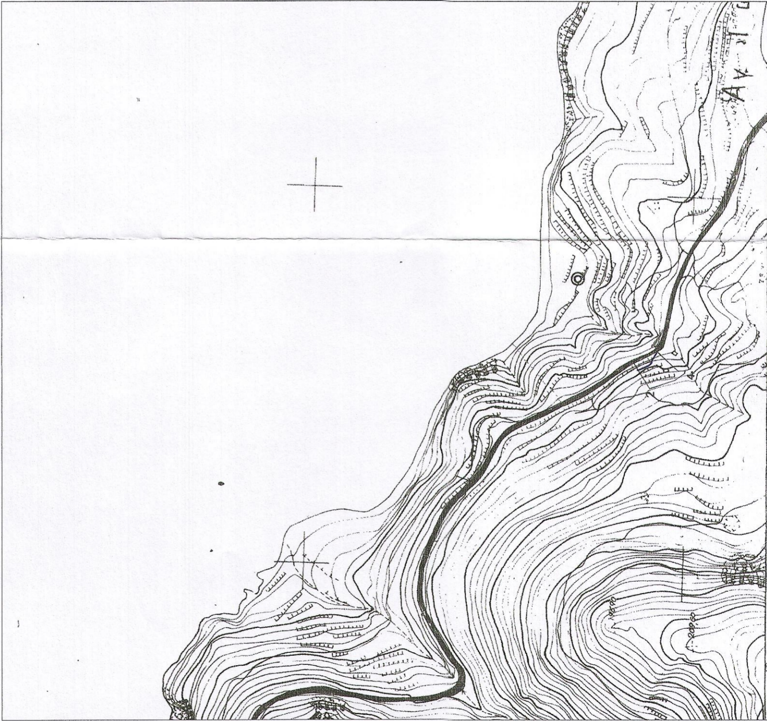
ΧΑΡΤΗΣ Γ.Υ.Σ. 6490-4 κλίμακα 1:5000

ΚΩΝΣΤΑΝΤΙΝΑ Β. ΣΤΑΥΡΟΥ ΔΙΠΛΩΜ. ΠΟΛΙΤΙΚΟΣ ΜΗΧΑΝΙΚΟΣ Ε.Μ.Π. ΜΕΛΟΣ Τ.Ε.Ε. Α.Μ. 99763 Α.Φ.Μ. 100212284 Π.Π. ΓΕΡΜΑΝΟΥ 37 ΑΓ. ΒΑΡΒΑΡΑ ΤΗΛ: 2105698999 - 6972724852