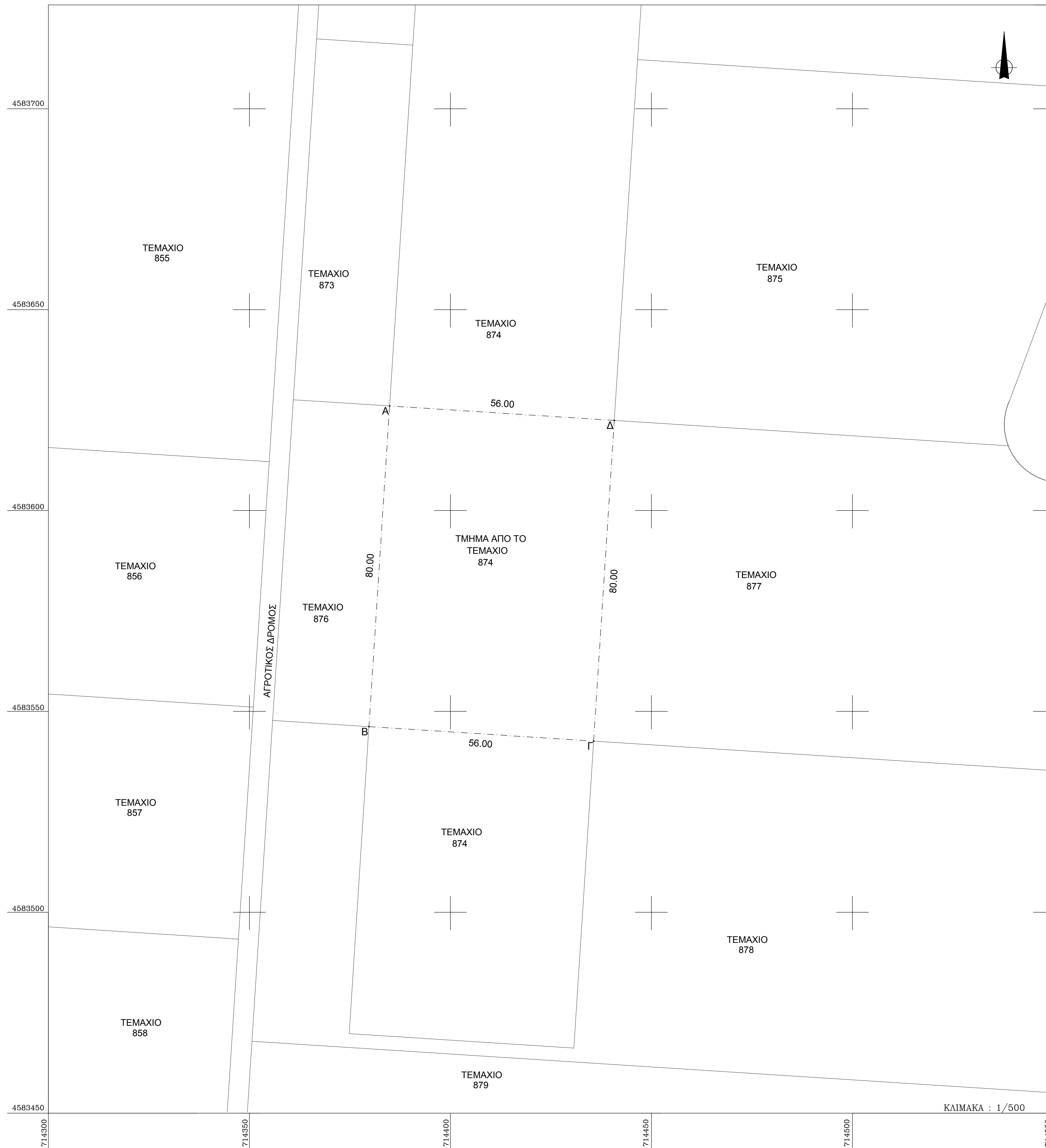
ΑΠΟΣΠΑΣΜΑ ΔΙΑΝΟΜΗΣ 1932 ΠΕΡΙΟΧΗΣ ΑΣΗΜΕΝΙΟΥ