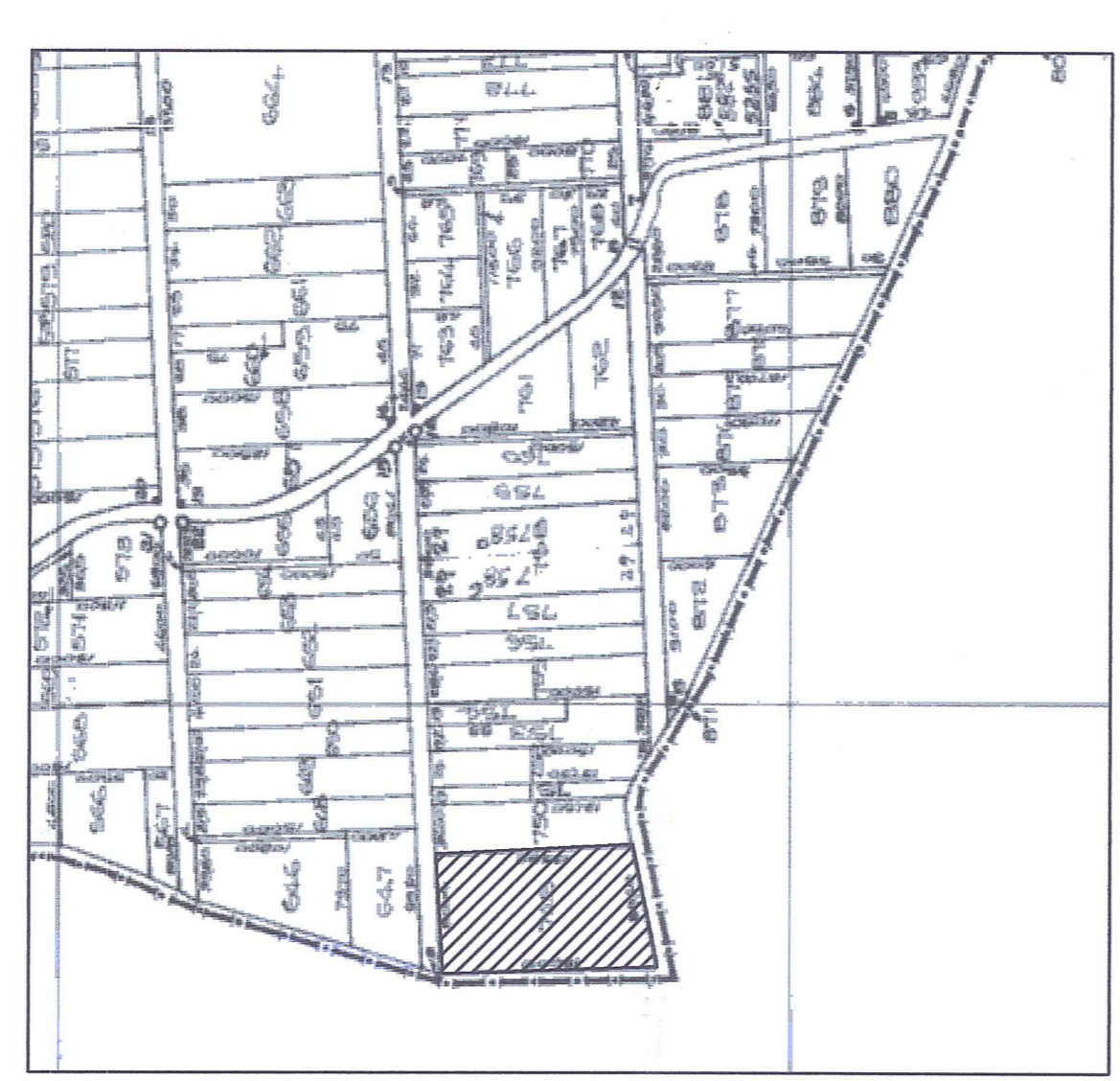
ΧΑΡΤΗΣ ΑΝΑΔΑΣΜΟΥ " ΡΙΖΩΜΑ "

Ελέγχθηκε ΤΡΙΚΛΑΜΑ 2-9-17 ΣΥΣ. ΜΕΤΡΗΣΕΩΝ 2-9-17 ΑΝΤΩΝΙΟΣ Γ. ΜΑΝΩΣ ΑΡ. ΔΙΑΣΤΑΣΙΩΣ