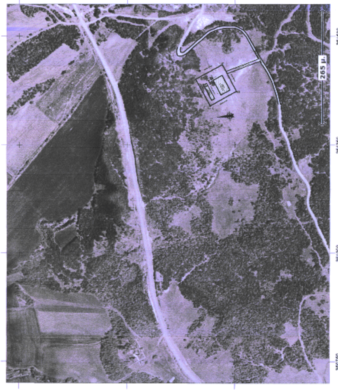
ΟΡΘΟΦΩΤΟΧΑΡΤΗΣ Ε.Κ.Χ.Α. 1:5000