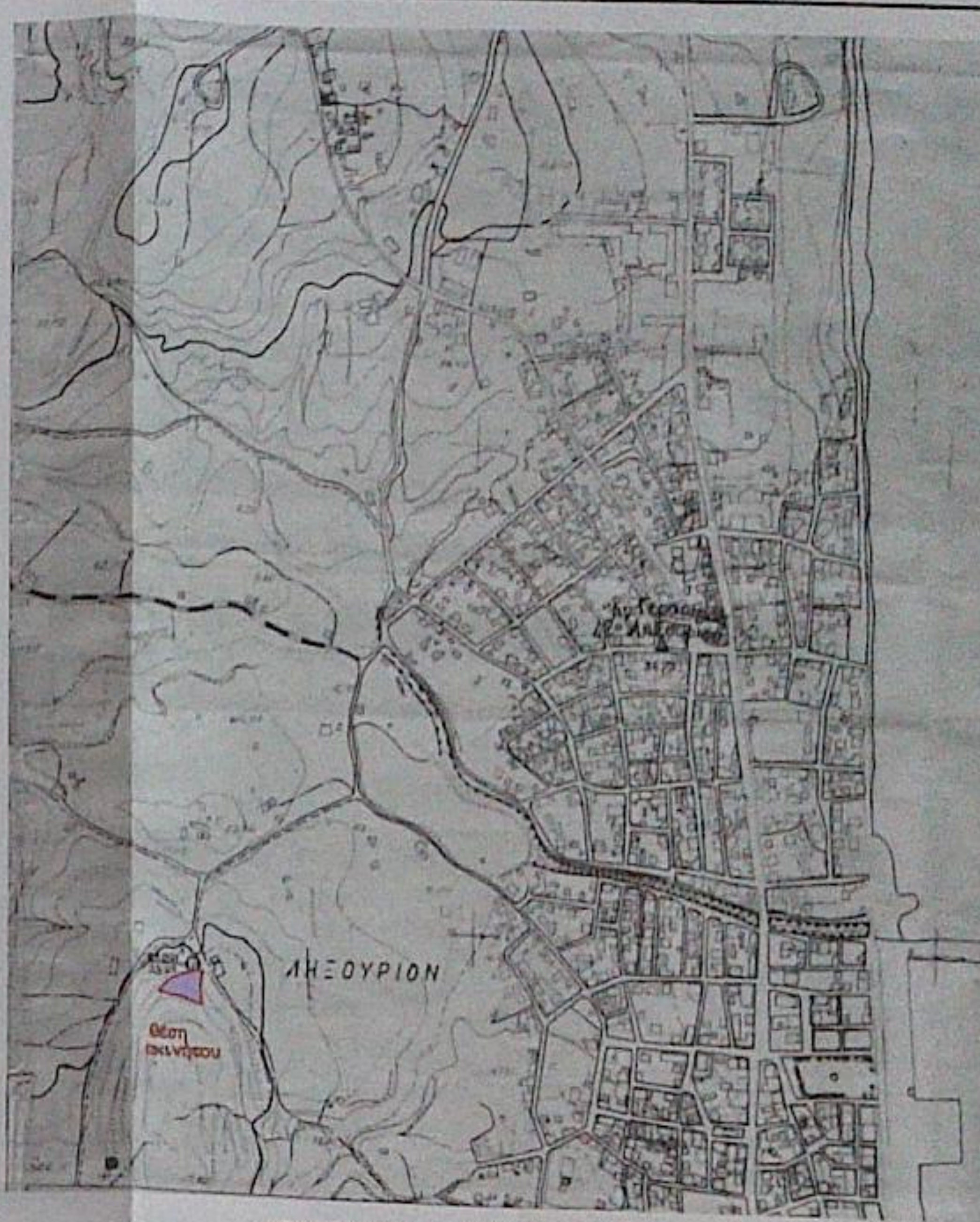
ΑΠΟΣΠΑΣΜΑ ΧΑΡΤΗ ΓΥΣ ΚΛΙΜΑΚΑΣ 1/5000

ΤΕΧΝΙΚΟ ΓΡΑΦΕΙΟ ΝΙΚΟΣ ΜΑΡΚΑΤΟΣ πολιτικός μηχανικός Παύλου Δελλαπόρτα 13 Ληξούρι, Κεφαλονιάς email: nicos@toponet.gr ΤΗΛ: 2671092196 FAX: 2671091893 ΕΙΔΙΚΟΤΗΤΕΣ Μηνιάτη Περεσφώνη-Μαρίνα και Μηνιάτης Κωνσταντίνος ΕΡΓΟ: ΑΠΟΤΥΠΩΣΗ ΑΚΙΝΗΤΟΥ