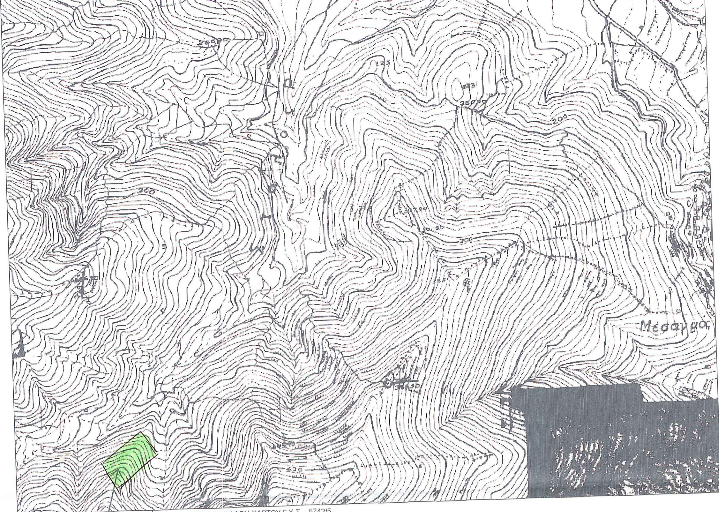
ΑΡΙΘΜΟΣ ΦΥΛΛΟΥ ΧΑΡΤΟΥ Γ.Υ.Σ. 5742/5 ΚΛΙΜΑΚΑ 1:5000

ΔΗΛΩΣΗ ΥΠΟΠΟΙΗΣΗΣ ΟΡΙΑΝ Τα αναγραφόμενα στοιχεία για το εν λόγω γήπεδο που είναι ιδιοκτησία μου είναι απόλυτα ακριβή, τα δε όρια του γηπέδου τέθηκαν παρουσία μου και με υπόδειξη μου ΙΟΥΝΙΟΣ 2016 Η ΔΗΛΩΣΑ