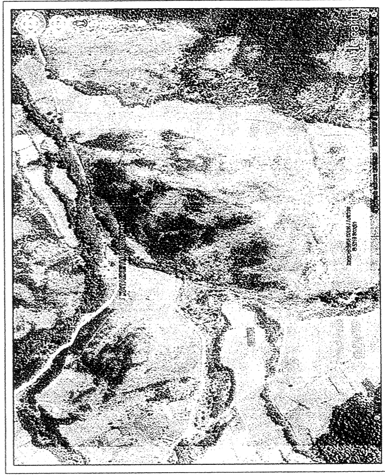
ΑΠΟΣΠΑΣΜΑ ΧΑΡΤΗ ΑΠΟ GOOGLE EARTH

ΔΗΛΩΣΗ ΙΔΙΟΚΤΗΤΗ (Ν. 4030/2011) Οι κάτωθι υπογεγραμμένοι δηλώνουν υπεύθυνα & εν γνώσει των συνεπειών του νόμου περί ψευδούς δηλώσεως ότι :