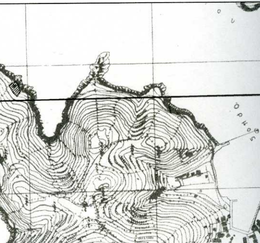
ΑΠΟΣΤΑΣΙΑ ΧΑΡΤΗΣ ΓΥΣ 7670/7 & 7670/8 - ΚΑΙΜΑΚΑ 1:5.000

ΑΠΟΣΤΑΣΙΑΣ ΟΡΘΟΦΩΤΟΧΑΡΤΗΣ - ΚΑΙΜΑΚΑ 1:1.000 ΕΡΓΑΣΙΑΣ ΑΠΟΣΤΑΣΙΑΣ ΟΡΘΟΦΩΤΟΧΑΡΤΗΣ - ΚΑΙΜΑΚΑ 1:1.000 ΕΡΓΑΣΙΑΣ ΑΠΟΣΤΑΣΙΑΣ ΟΡΘΟΦΩΤΟΧΑΡΤΗΣ - ΚΑΙΜΑΚΑ 1:1.000