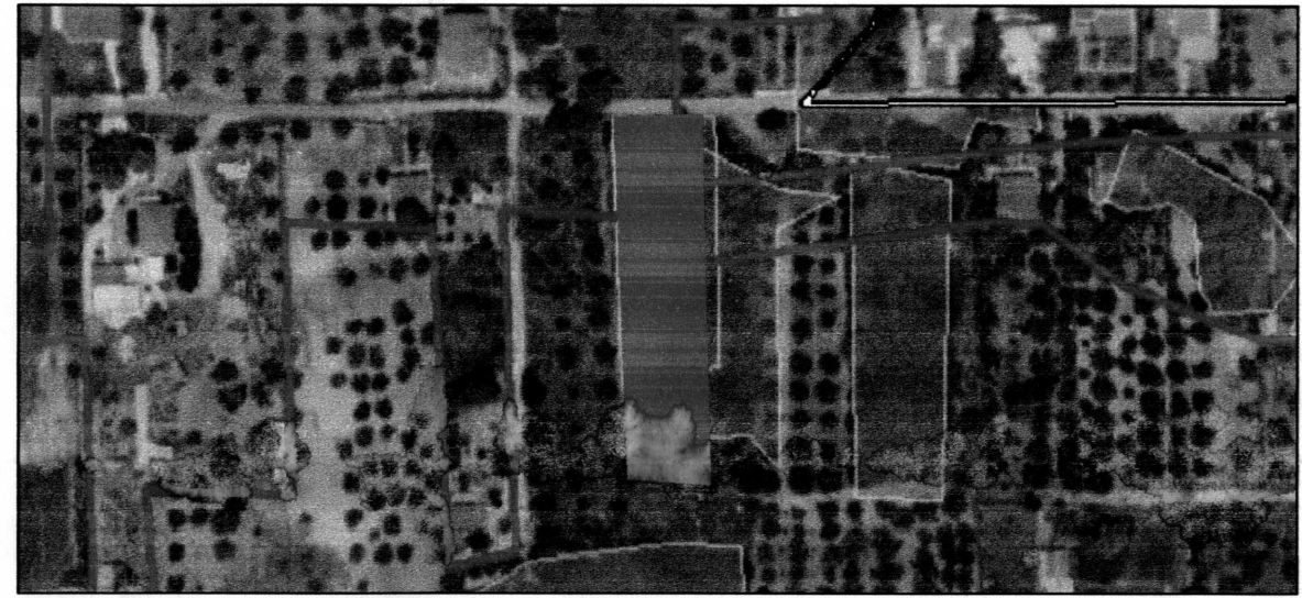
ΠΙΝΑΚΑΣ ΣΥΝΤ/ΝΩΝ ΚΟΡΥΦΩΝ ΚΑΙ ΤΟΜΩΝ ΟΙΚΙΣΤΙΚΗΣ ΠΥΚΝΩΣΗΣ, ΟΡΙΩΝ ΙΔΙΟΚΤΗΣΙΑΣ & ΚΤΙΣΜΑΤΟΣ

ΟΡΘΟΦΩΤΟΧΑΡΤΗΣ Ημ/νια Φωτοληψίας 2007-2009 Κλίμακα 1/2000