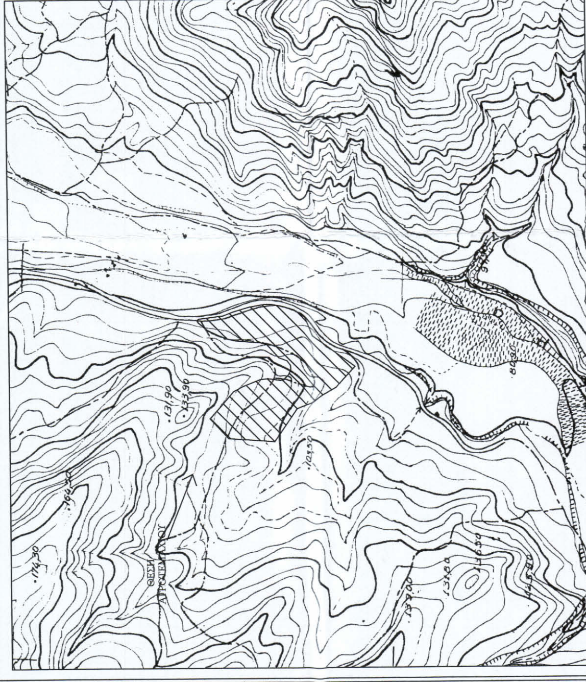
ΑΠΟΣΠΑΣΜΑ ΧΑΡΤΗ Γ.Υ.Σ. 53742 ΚΑΙΜΑΚΑ 1 : 5.000