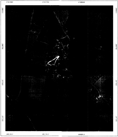
Αεροφωτογράφημα Ελληνική Κτηματολόγιον Κλίμακα 1/5000