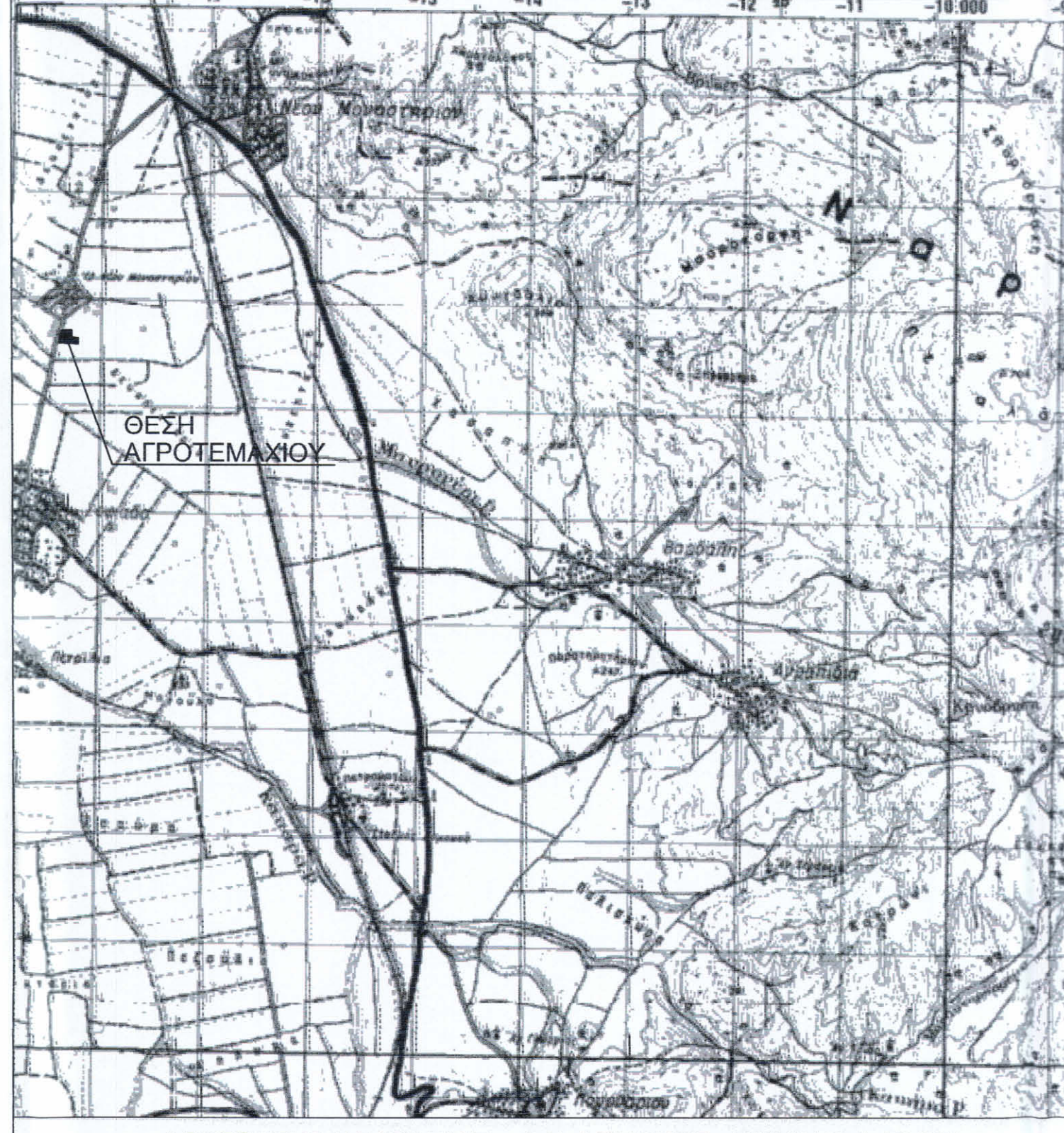
ΑΠΟΣΠΑΣΜΑ ΧΑΡΤΗ Γ.Υ.Σ. - Φ.Χ. ΔΟΜΟΚΟΣ - ΚΛΙΜΑΚΑ 1: 50.000

ΔΗΛΩΣΗ ΜΗΧΑΝΙΚΟΥ (Ν. 651/77) Ο κάτωθι υπογεγραμμένος ΠΑΝΑΓΙΩΤΗΣ ΣΤΑΜΑΤΗΣ, Τοπογράφος Μηχανικός, δηλώνω σύμφωνα με το νόμο, για το αγροτεμάχιο με στοιχεία Α,Β,Γ,Δ,Ε,Ζ-Α και εμβαδόν E=15685.00m^2 , που βρίσκεται επί της κτηματικής περιφέρειας Τ.Κ. Νέου Μοναστηρίου, Δημοτικής Ενότητας Θεσσαλιώτιδας, Δήμου Δομοκού, Περιφερειακής Ενότητας Φθιώτιδας, Περιφέρειας Στερας Ελλάδας, ότι: α) το εν λόγω αγροτεμάχιο είναι άρτιο και οικοδομήσιμο ως προς το εμβαδόν και τις διαστάσεις σύμφωνα με τις πολεοδομικές διατάξεις που ισχύουν σήμερα. β) βρίσκεται εκτός σχεδίου πόλεως και εκτός ορίων οικισμού. γ) δεν εμπίπτει στις διατάξεις του Νόμου 1337/83 περί εισφορών σε γη και χρήμα δ) εντός αυτού δε διέρχονται εναέριες γραμμές μεταφοράς υψηλής τάσης της ΔΕΗ και αγωγός φυσικού αερίου. ε) εντός αυτού ή σε απόσταση μικρότερη των 20μ δε διέρχεται ρέμα. Λαμία, Φεβρουάριος 2020 Ο Μηχανικός ΠΑΝΑΓΙΩΤΗΣ ΗΛ. ΣΤΑΜΑΤΗΣ ΑΓΡΟΝΟΜΟΣ & ΤΟΠΟΓΡΑΦΟΣ ΜΗΧ ΚΟΣ ΔΙΠΛ. ΕΘΝΙΚΟΥ ΜΕΤΡΩΝ ΠΟΛΥΤΕΧΝΕΙΟΥ ΜΕΛΟΣ Τ.Ε.Ε. ΑΡΧΙΤΕΚΤΟΝΩΝ ΜΗΤΡΩΟΥ: 85838 ΟΔΟΣ 1 & ΗΡΩΩΝ Τ.Κ. 35100 ΛΑΜΙΑ ΤΗΛ: 2410 66075 ΑΦΜ 11765217 ΔΟΥ ΛΑΜΙΑΣ