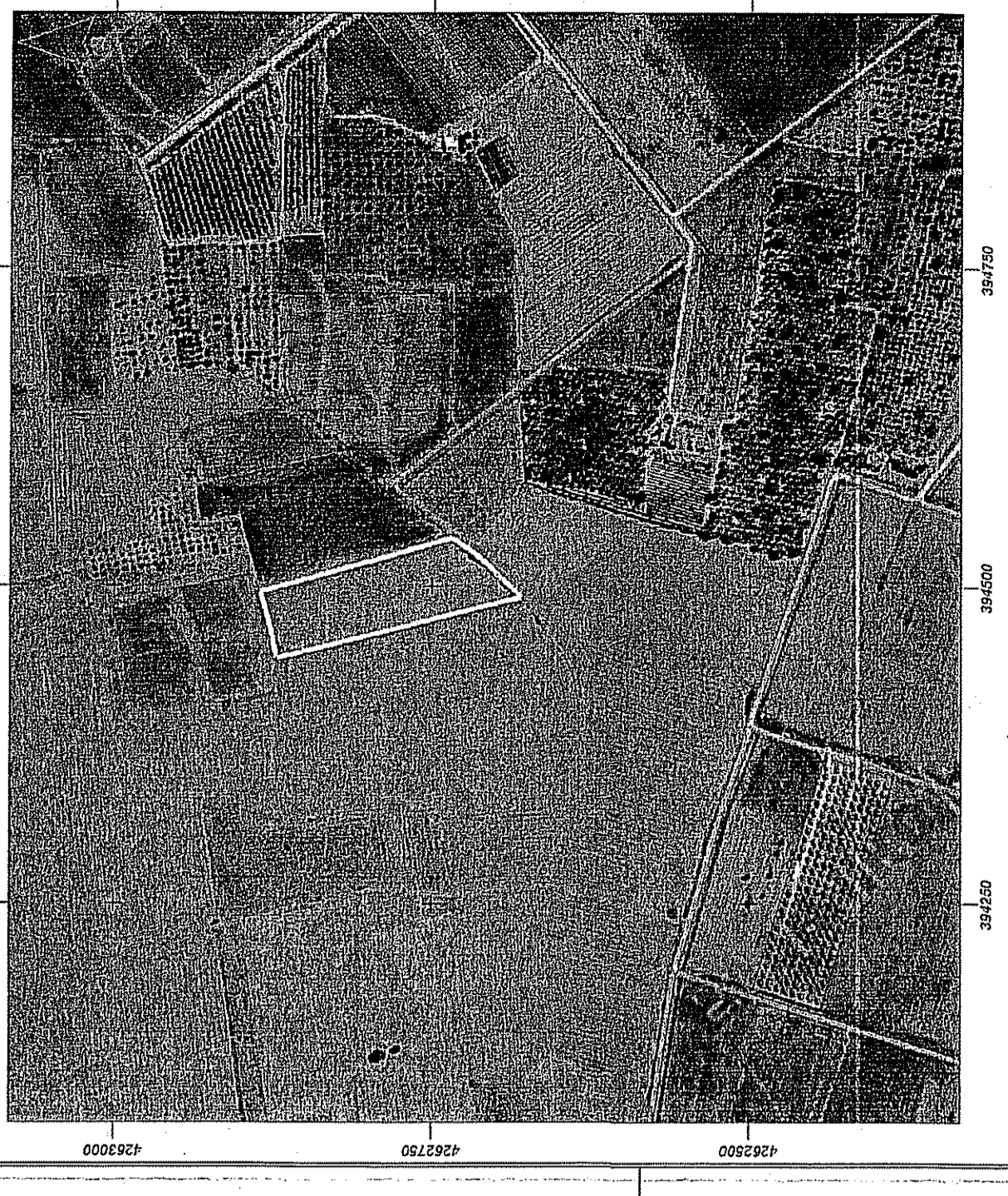
ΑΠΟΣΠΑΣΜΑ ΔΟΥΡΦΟΡΙΚΗΣ ΚΤΗΜΑΤΟΛΟΓΙΟΥ - ΘΕΣΗ ΙΔΙΟΚΤΗΣΙΑΣ