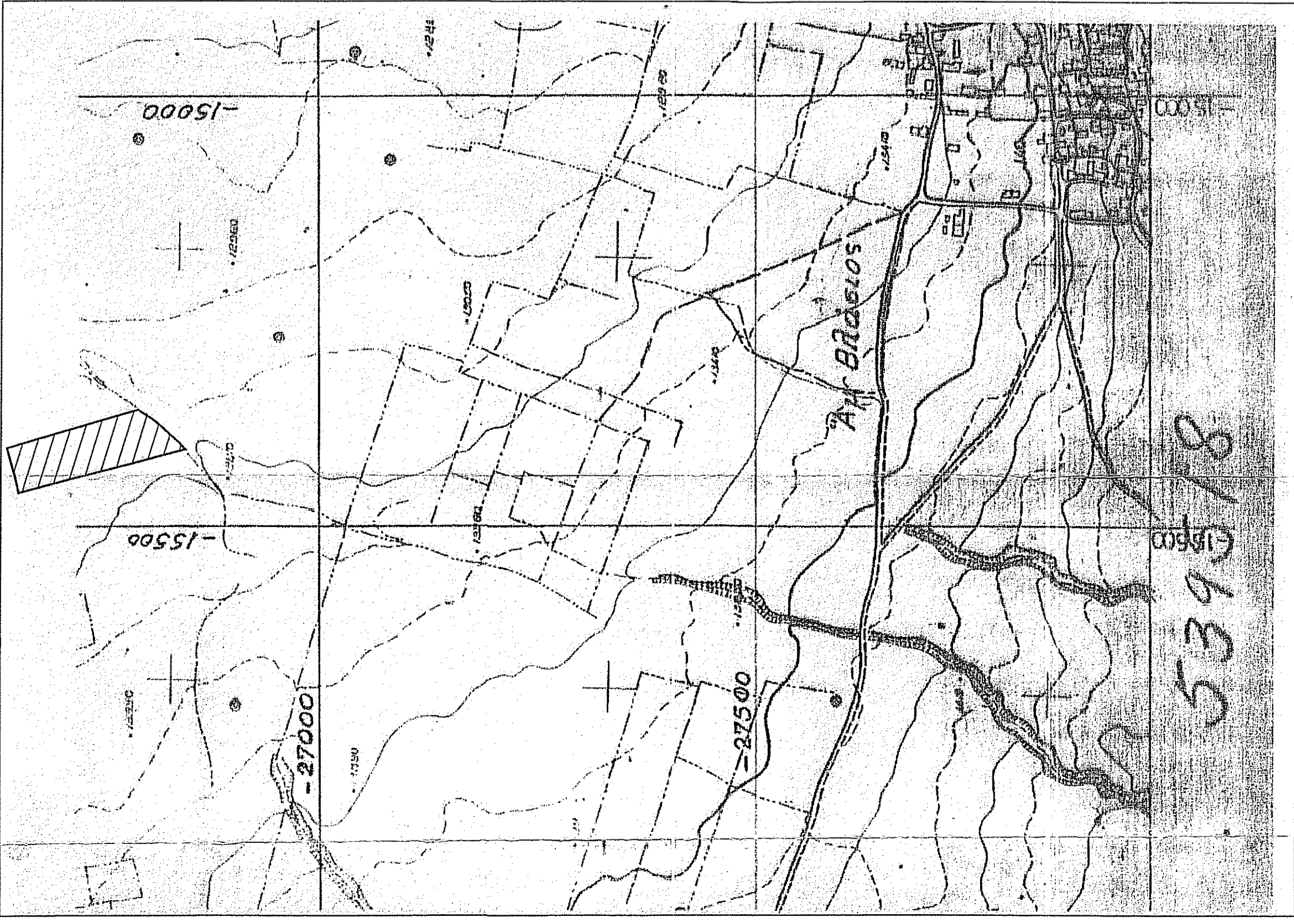
ΑΠΟΣΠΑΣΜΑ Φ.Χ. ΓΥΣ ΕΛΑΤΙΑΣ (5395-8) - ΚΛΙΜΑΚΑ 1 : 5000