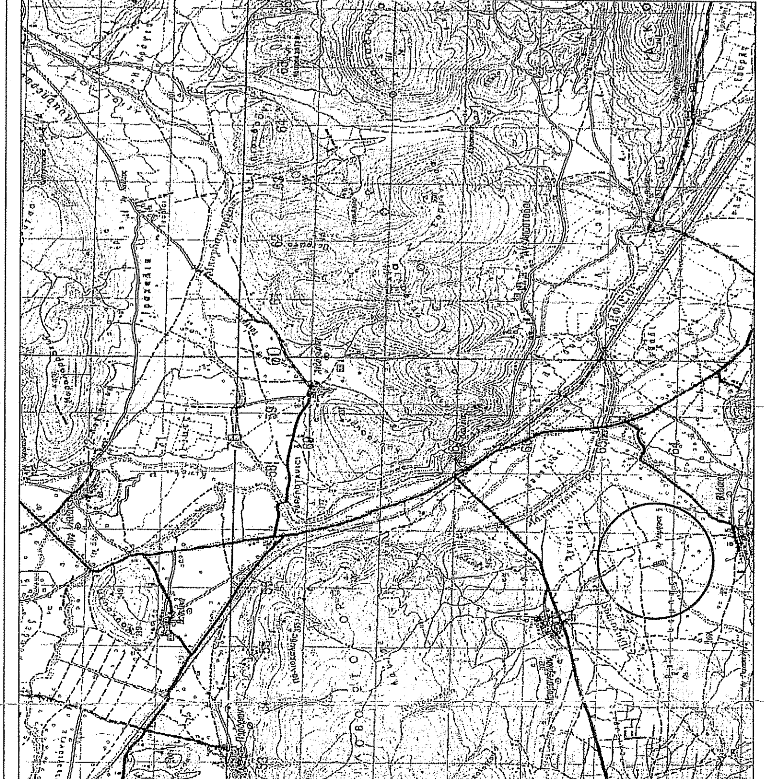
ΑΠΟΣΠΑΣΜΑ Φ.Χ. ΓΥΣ ΕΛΑΤΙΑ (100) - ΚΛΙΜΑΚΑ 1 : 50000