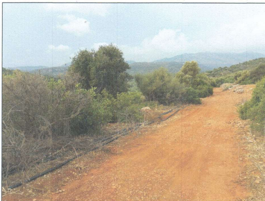
ΦΩΤΟΓΡΑΦΙΑ ΑΠΟ ΘΕΣΗ ΛΗΨΗΣ 1