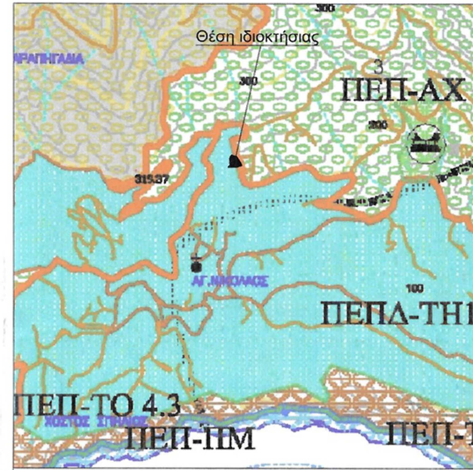
ΑΠΟΣΠΑΣΜΑ ΧΑΡΤΗΣ ΣΧΟΟΑΠ Δ. ΛΑΜΠΗΣ ΚΛΙΜΑΚΑ 1:10.000

ΙΩΑΝΝΗΣ ΕΜΜ. ΜΠΑΝΤΙΝΑΚΗΣ ΜΗΧΑΝΙΚΟΣ ΕΠΙΧΕΙΡΗΣΙΟΥ ΤΟΠΟΓΡΑΦΙΚΟΥ ΚΑΙ ΤΟΠΟΓΡΑΦΙΚΟΥ ΚΑΤΑΣΤΑΣΙΟΥ ΚΑΡΔΙΑΣ Τ.Ε.Ε. - Α.Μ. 58032 - Α.Φ.Μ. 044127380 ΚΟΝΔΥΛΑΚΗ 85 - ΤΑΧ. ΠΕΘΥΜΝΟ ΤΗΛ: 28310 51796