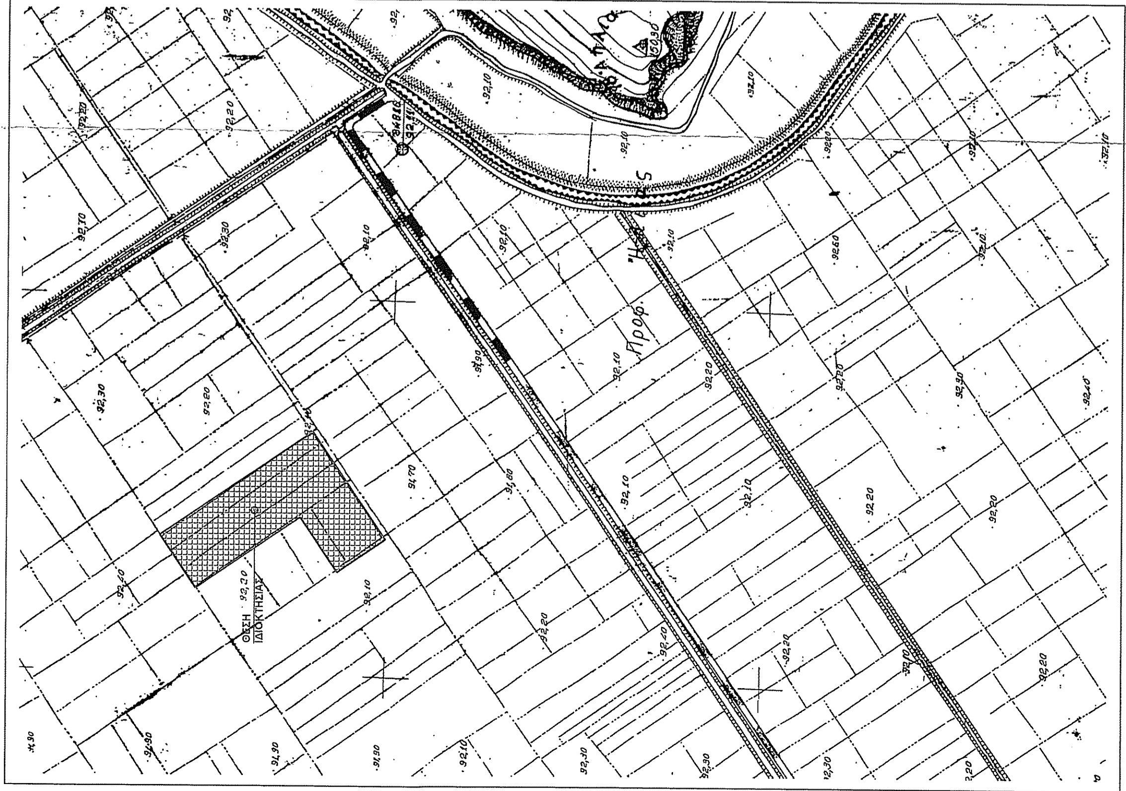
Απόσταση διαγράμματος 1:5000 της Γ.Υ.Σ. αρ.φ.χ. 6309-Ζ