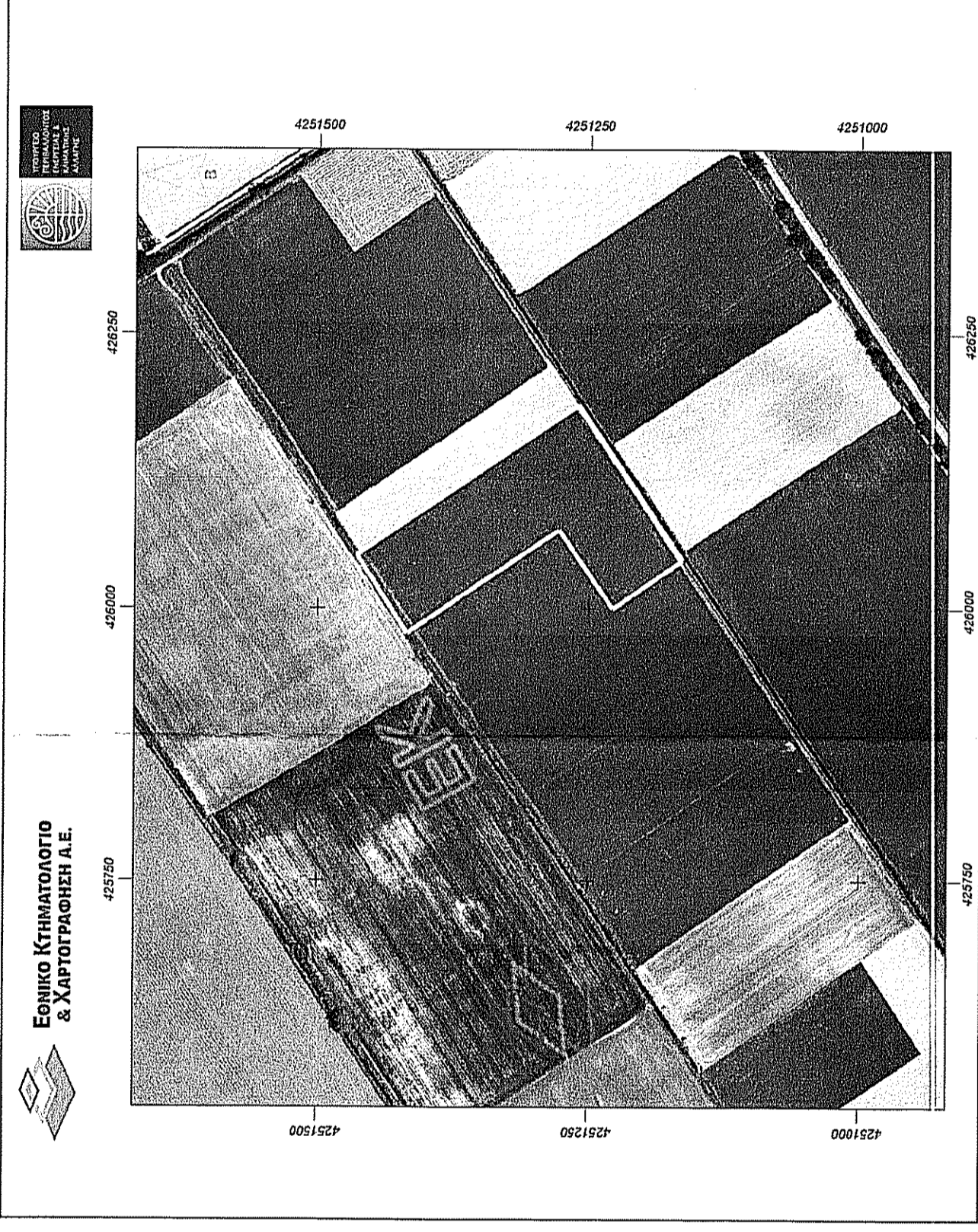
Απόσταση ορθοφωτογραφίας της ΕΚΧΑ Α.Ε.