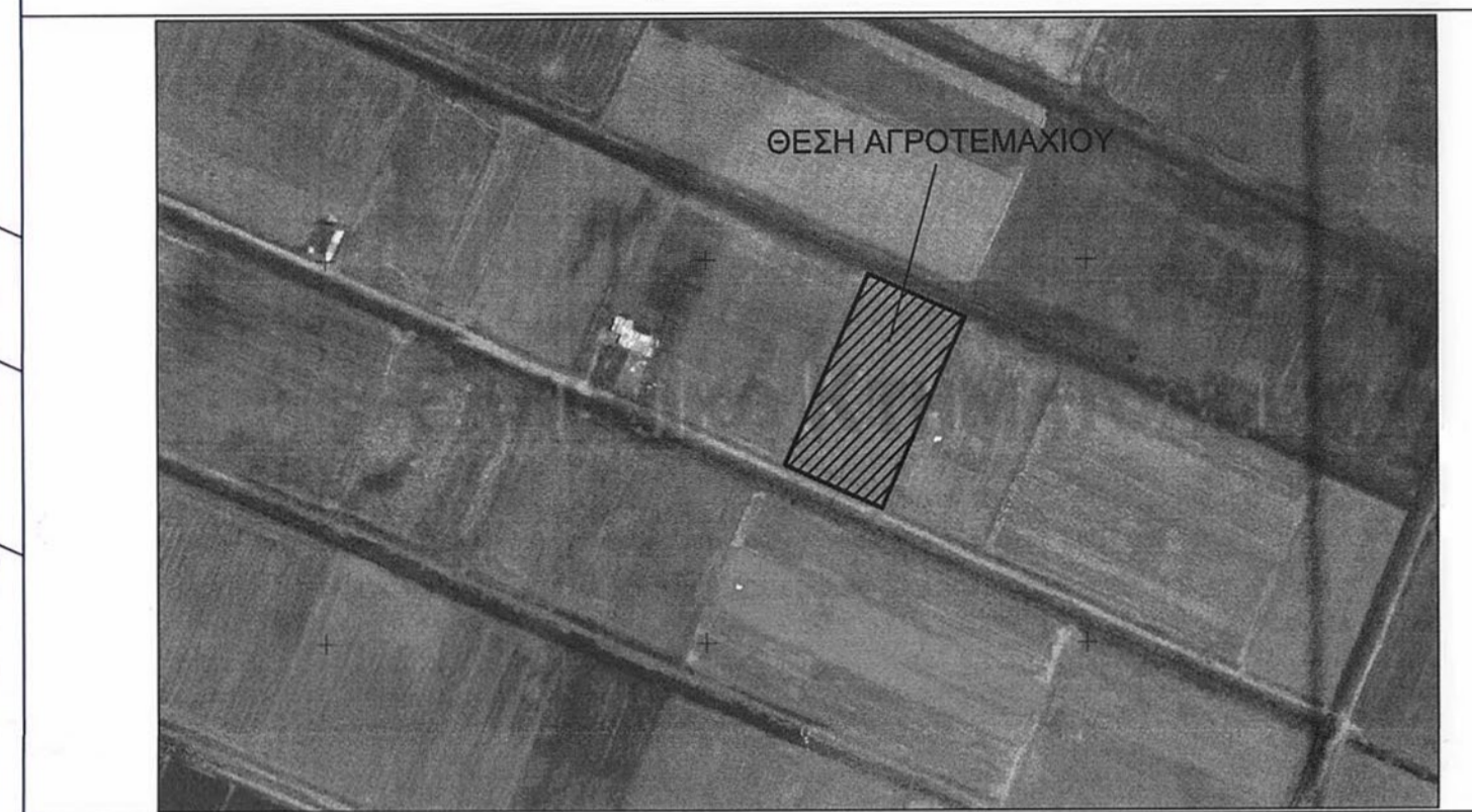
ΑΠΟΣΠΑΣΜΑ ΟΡΘΟΦΩΤΟΧΑΡΤΗ ΕΥΡΥΤΕΡΗΣ ΠΕΡΙΟΧΗΣ - ΚΛΙΜΑΚΑ 1:5.000

ΜΕΛΕΤΗΤΗΣ: ΓΚΟΥΤΣΗ ΔΗΜΗΤΡΑ-ΦΑΒΙΟΛΑ ΕΡΓΟΔΟΤΗΣ: ΕΝΕΡΓΕΙΑΚΗ ΣΤΕΡΕΑΣ ΕΝΕΡΓΕΙΑΚΗ ΚΟΙΝΟΤΗΤΑ ΠΕΡΙΟΡΙΣΜΕΝΗΣ ΕΥΘΥΝΗΣ ΘΕΜΑ: ΤΟΠΟΓΡΑΦΙΚΟ ΔΙΑΓΡΑΜΜΑ ΘΕΣΗ: ΘΕΣΗ: "ΜΕΝΤΑΝΗΣ", ΚΤΗΜΑΤΙΚΗ ΠΕΡΙΦΕΡΕΙΑ ΜΕΓΑΛΗΣ ΒΡΥΣΗΣ, Τ.Κ. ΜΕΓΑΛΗΣ ΒΡΥΣΗΣ, Δ.Ε. ΛΑΜΙΕΩΝ, ΔΗΜΟΣ ΛΑΜΙΕΩΝ