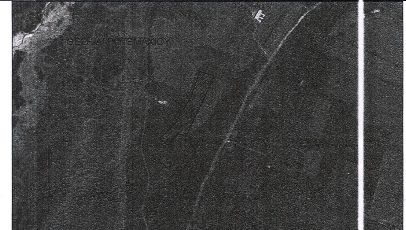
ΑΠΟΣΠΑΣΜΑ ΟΡΘΟΦΩΤΟΧΑΡΤΗ ΕΥΡΥΤΕΡΗΣ ΠΕΡΙΟΧΗΣ - ΚΛΙΜΑΚΑ 1:5.000

ΜΕΛΕΤΗΤΗΣ: ΓΚΟΥΤΣΗ ΔΗΜΗΤΡΑ-ΦΑΒΙΟΛΑ ΕΡΓΟΔΟΤΗΣ: ΕΥ ΕΝΕΡΓΕΙΑΚΗ ΤΕΧΝΙΚΗ & ΕΜΠΟΡΙΚΗ Ε.Π.Ε. ΘΕΜΑ: ΤΟΠΟΓΡΑΦΙΚΟ ΔΙΑΓΡΑΜΜΑ ΘΕΣΗ: ΘΕΣΗ: "ΚΟΚΚΙΝΙΕΣ-ΣΚΥΛΑΜΠΕΛΑ" ΚΤΗΜΑΤΙΚΗ ΠΕΡΙΦΕΡΕΙΑ ΥΠΑΤΗΣ Τ.Κ. ΥΠΑΤΗΣ, Δ.Ε. ΥΠΑΤΗΣ, ΔΗΜΟΣ ΛΑΜΙΕΩΝ