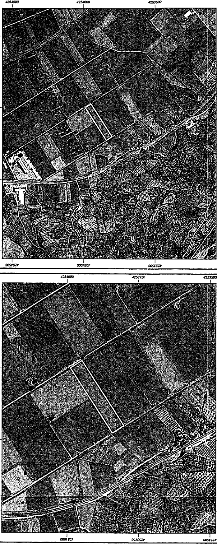
ΟΔΟΠΟΙΗΤΙΚΟ - ΑΠΟΣΠΑΣΜΑ ΑΠΟ ΟΡΘΟΦΩΤΟΓΡΑΦΙΕΣ ΚΥΜΑΤΟΛΟΓΙΟΥ