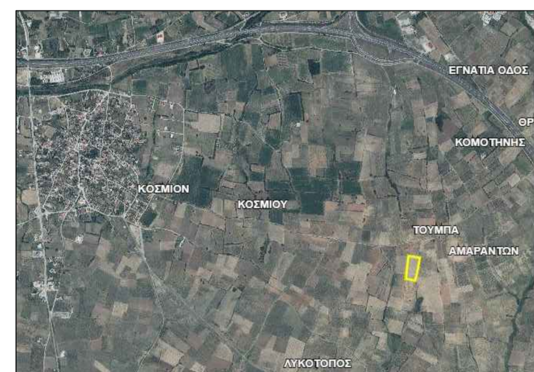
ΑΠΟΣΠΑΣΜΑ ΕΥΡΥΤΕΡΗΣ ΠΕΡΙΟΧΗΣ - ΘΕΣΗ ΓΗΠΕΔΟΥ